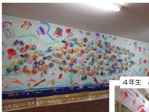
2年生 力を合わせて大きな魚