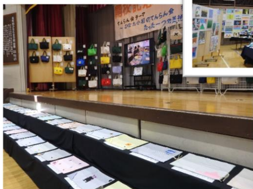
5・6年生 家庭科作品