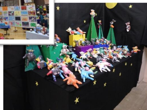
みどり ねこねこ大集合！