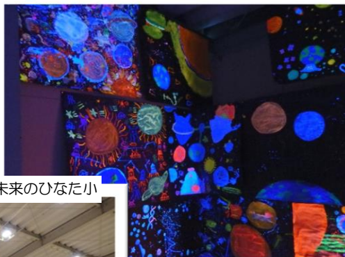
5年生 ひなた小 IN SPACE