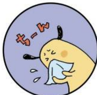
はな あと 鼻をかんだ後