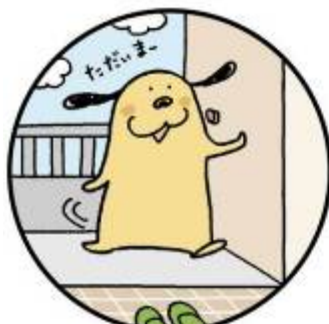
いえ かえ とき 家に帰った時