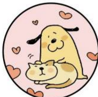
どうぶつ さわ とき 動物に触った時