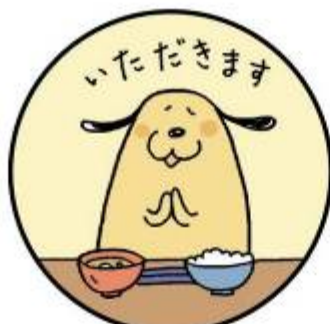
しょうじ まえ 食事の前

手洗いの目的は、手から汚れを洗い落として清潔にすることです。目に見える汚れのほかにも、目に見えない細菌やウイルスなどがついていることがあります。体内に細菌やウイルスを持ち込まないようにしっかりと手を洗うことが重要です。