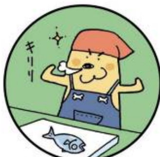
りょう り まえ 料理をする前