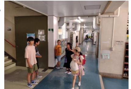
町三小恒例のあいさつ運動

逆に考えると、今の高学年児童の立派な姿があるのは、これまでに卒業していった先輩たちがそのような姿を見せてきてくれたからに他なりません。児童がつないできたこの素敵な町三小の伝統のバトンを、これからも大切に受け継いでいきたいです。