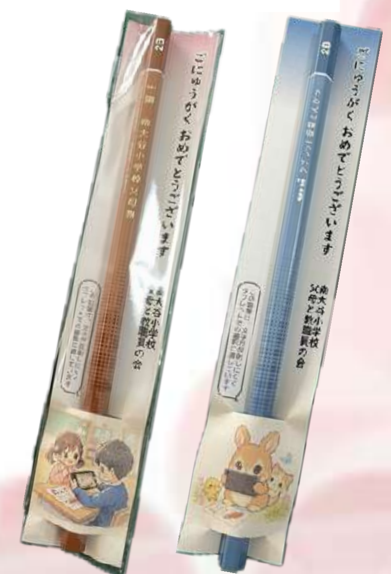
新一年生への贈り物