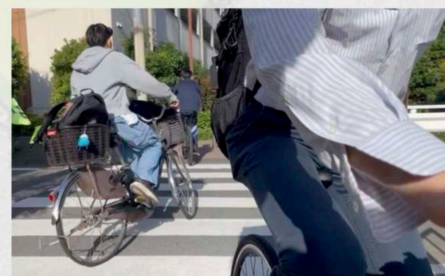
登校時の横断歩道の様子

南大谷小学校では、交通ボランティアさんを随時募集しております。毎日でなくても大丈夫です! ご紹介して頂ける方がいましたら父母教のアドレスまでご連絡下さい