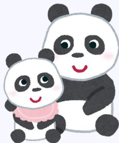
イメージ画像です。