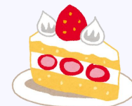
イメージ画像です。