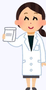
イメージ画像です。