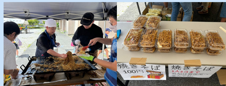
M0こもこ夏祭り2024では焼きそば屋台を出店しました! 来てくれた皆さん、ありがとう!