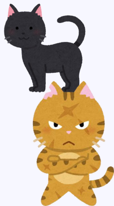
イメージ画像です。

みなみおおや大図鑑で教職員の方々にお答え頂いた、おすすめの本、映画、漫画から、少しずつご紹介しています。 今回も、複数回答のあったものからいくつかご紹介致します。