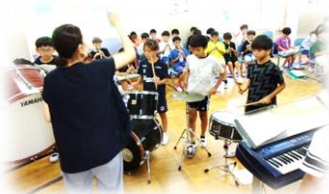
▲5年生 連合音楽会の練習

すべき「本町田ひなた小学校の1期生」としての自覚と、あるべき姿を追求していってもらいます。そのために、早速それぞれの学年で、連合行事に向けた取組が始まっています。6年生は18日（金）の連合体育大会、5年生は11月13日（水）実施の連合音楽会に向けて、どちらも練習に励んでいます。さらに5年生は、校外学習（社会科見学・スノーピーミュージアム・スキー教室）が続き、学校の外でも、高い目的意識と相応しい態度を求めていきたいと考えています。それ以外の学年についても、着実に次年度に向けたレディネス（準備）を進めていく後期の教育課程となります。私たち教員は、子どもたちの可能性を信じながら、その可能性をいかに引き出していくかを、日々模索していきます。そのために、引き続きご家庭との連携については、何よりも重要な要素だと考えております。学校とご家庭がともに手を取り合いながら、実りの多い後期の教育活動を進めていければと思ひます。どうぞ、今後ともご協力のほど、よろしくお願ひいたします。