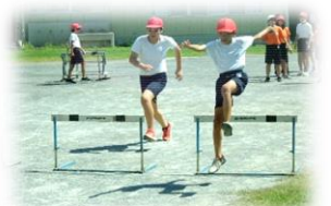
▲6年生 連合体育大会の練習

さて、15日（火）からの後期は、様々な学校行事が続きます。今月末の子どもまつりに続き、11月8日・9日には学習発表会も開催されます。各学年で、すでに一部準備が進められていますが、特に6年生は、「本町田小最後の卒業生」として、この4月から叱咤激励しながら背中を押してきており、引き続き学校の顔として、下級生を牽引していってもらいます。そのうえで、この秋からは5年生にも、記念