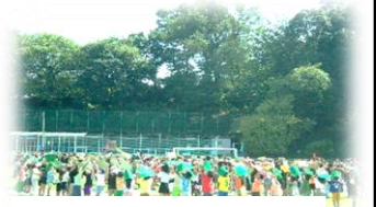
▲9月の航空写真撮影の様子

9月17日（火）に行われた航空写真撮影は、晴天の中で本町田小閉校の記念となる、現校章を図案とした写真を撮ることができました。今回は、全校児童と教職員全員の記念写真と各クラス写真の撮影を行います。各ご家庭におかれましては、お子様の体調管理にご配慮いただき、当日の撮影に参加できますように、よろしくお願ひいたします。