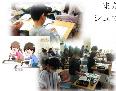
▲年末の書き初めの練習風景

しかし、昨年末からのインフルエンザなどの感染症の流行や、新年度の学校統合に伴う様々な不安などによる不定愁訴も懸念されます。もちろん、学校でもしっかり対応してまいります。各ご家庭でも日々のお子様の体調管理や、ちょっとした言動の変化にご留意いただき、全員が本町田小としての残りの日々を全うできるよう、連携して対応できたら考えています。本年も、どうぞ変わらぬご理解・ご協力を、よろしくお願いいたします。