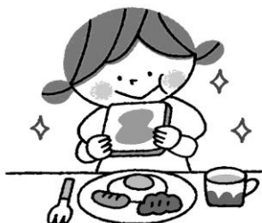
朝食をたべてエネルギー補充