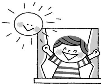
早起きして朝日をあびる