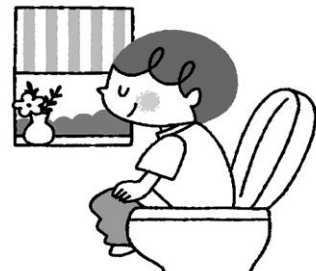
毎朝きもちよく排便する