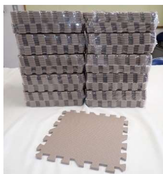
ちょっと多めに90枚購入。

早速、児童数分のマットを購入しました(左写真)。今年の水泳学習は、この「ほっしーカフェ発、パズルマット」をお尻に敷いてスタートします。カフェという偶然の場で出会った切実な声を、子どもたちの安全を守る「必然」の行動に変える。これぞ正に、「学校と保護者との共創」だと言えるでしょう。