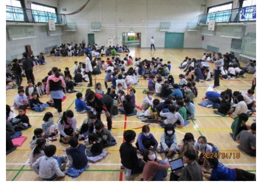
2~6年生が、各クラス3つのグループに分かれて車座になり、話し合いました。

児童は体育館でグループに分かれ、車座になって話し合い、意見を google フォームで入力・送信(右写真)。