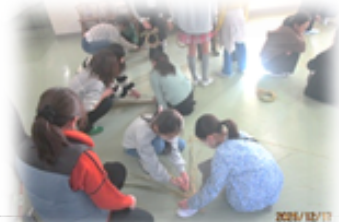
▲ 5年生 しめ縄作り体験

そして、現在学校でも、来年度の教育課程（教育目標や年間行事計画など）に向けての準備が始まっています。具体的には4月の新年度を迎えてからになりますが、子供たちと同じように「心機一転」で、前に進んでいくことも念頭に置きながら進めていきたいと考えています。そんな学校に対しては、保護者の皆様や地域の皆様の後押しが不可欠になりますので、引き続き2026年も鶴間小学校の教育活動に、変わらぬご理解・ご協力をよろしくお願いいたします。