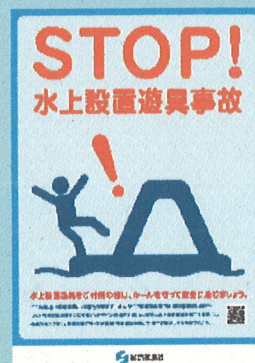
図2 水上設置遊具チラシ