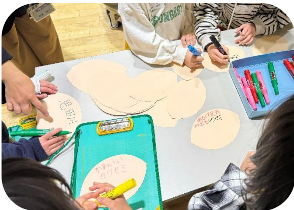
葉っぱに言葉や想いを書く