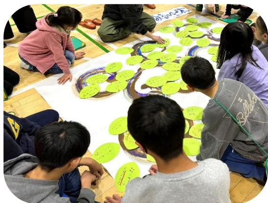
葉っぱを「木」に並べて整理する