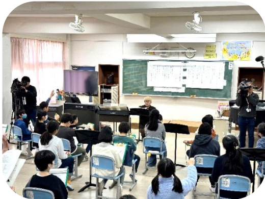
制作者に新しい校歌の想いを伝える

どんな校歌にしたいか、児童の想いを制作者に伝え、歌詞に入れたいフレーズや、様々な曲調を聴いて、新しい小学校にふさわしいメロディーをみんなで考えました。引き続き、児童と制作者の交流を重ねながら制作を進めます。