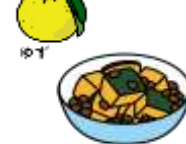
かぼちゃと小豆のいとこ煮

1年で最も昼が短く、夜が長くなる日。ゆず湯に入って身を清め、かぼちゃや小豆を食べて邪気をはらい、無病息災を祈る風習があります。