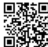
ウェブベルマーク 登録用 QR コード