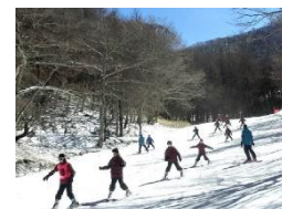
川上村移動教室5年