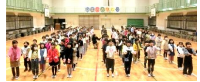
1年生 替歌「ありがとうの花」

子供たちの成長していく姿は大きな喜びです。学校は、道徳教育や特別活動などを通して子供同士が心豊かに関わり、様々な場面で助け合い、信頼や友情を育てていくように働きかけてまいります。