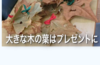
大きな木の葉はプレゼントに