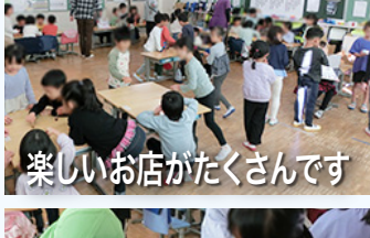
楽しいお店がたくさんです