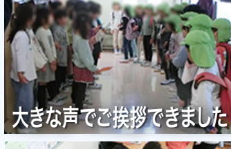
大きな声でご挨拶できました