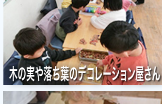
木の実や落ち葉のデコレーション屋さん