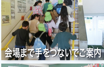
会場まで手をつないでご案内

年長さんたちに楽しんでもらう「秋まつり」を開催しました。秋に収穫した木の実や木の葉などを使って、どんぐりゴマ、迷路、ボウリング、輪投げ、楽器づくりなど、工夫を凝らした楽しいお店を準備した子どもたち。迷っている年長さんには「こっちも楽しいよ！」と元気に声をかけたり、遊び方を一生懸命伝えたりして、入学してから感じた「嬉しかったこと」を実践する姿が見られ、頼もしく成長した姿がありました。始まりと終わりの挨拶も堂々として、教室から玄関までは手をつなぎ、お見送りの時は名残惜しそうな様子が印象的でした。今年も素敵な秋まつりになりました。