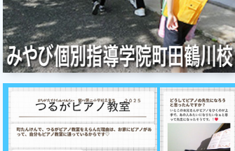
みやび個別指導学院町田鶴川校

今年度も15か所のお店や施設の皆様に快くご協力いただき、保護者の皆様にも引率をお手伝いいただいたおかげで、大変充実した町探検になりました。ご協力ありがとうございました。