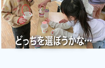
どっちを選ぼうかな…