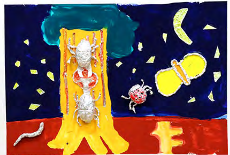
3年 キラキラいぼい虫の森