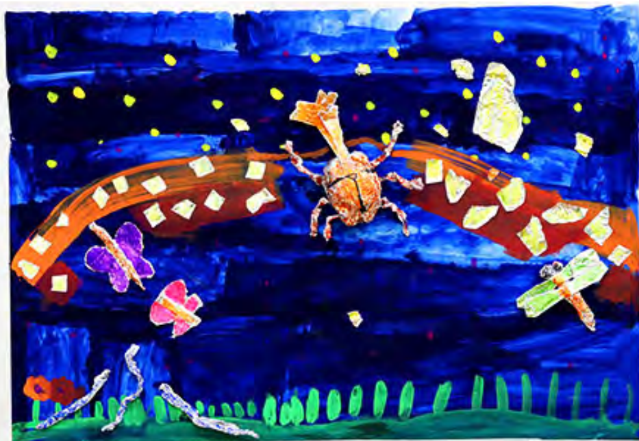
3年 きらきらの世界