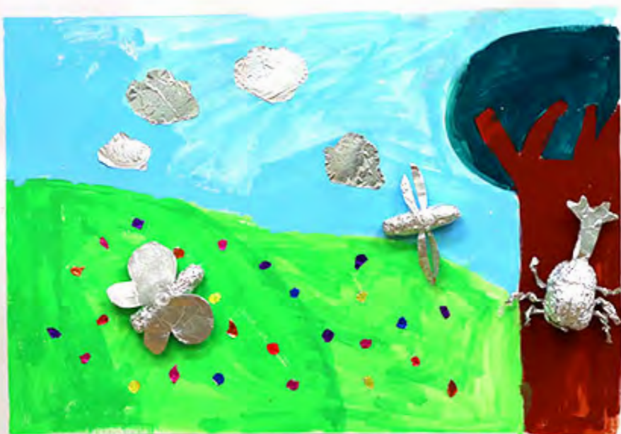
3年 虫さんたちの花はたけ