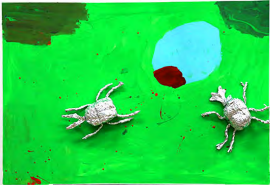
3年 のんびり雨の日