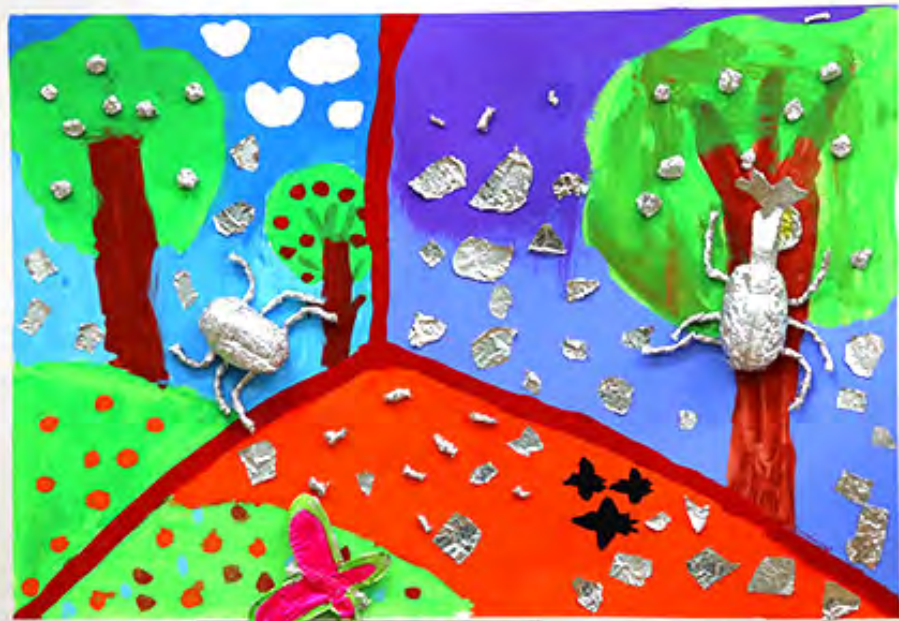
3年 朝昼夜のキラキラ虫