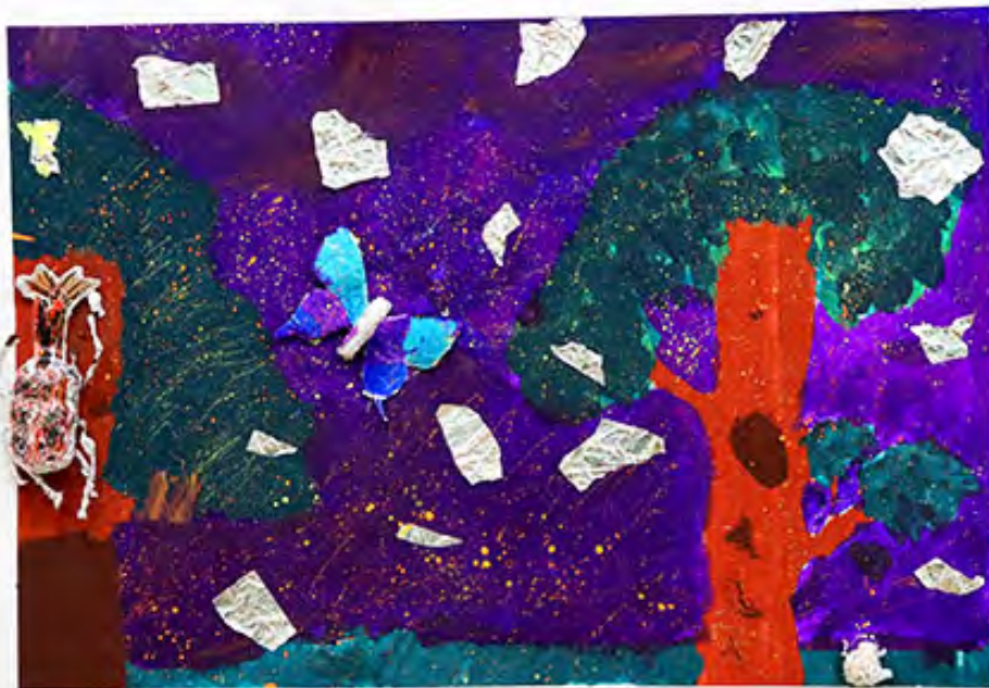
3年 こん虫がいる きらきらしたしずかな森