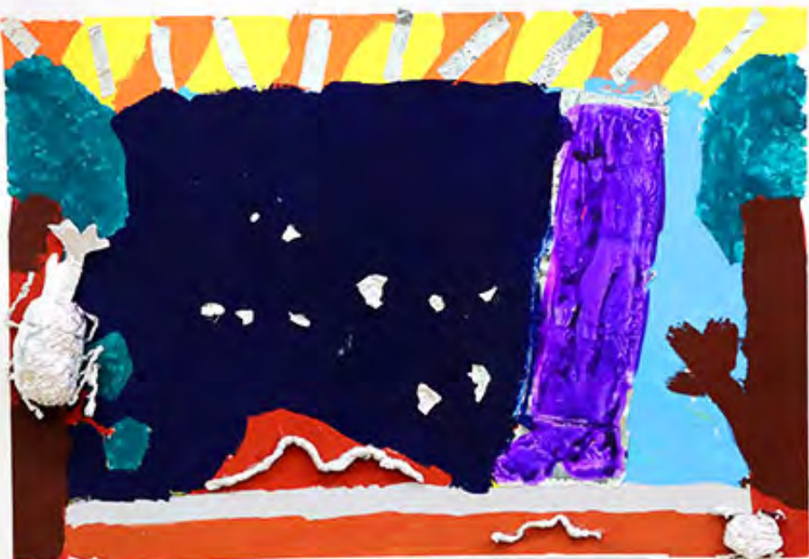
3年 明るいさん虫たち