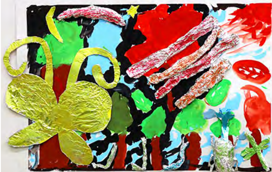
3年 いろいろなせかい