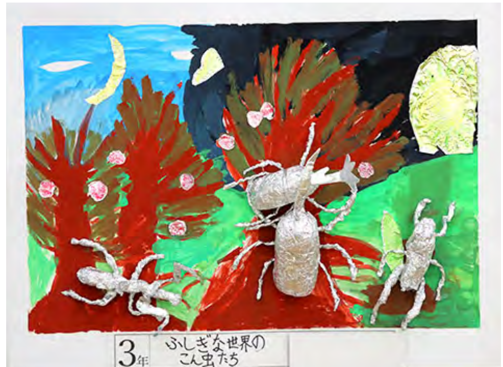
3年 ふしぎな世界の こん虫たち