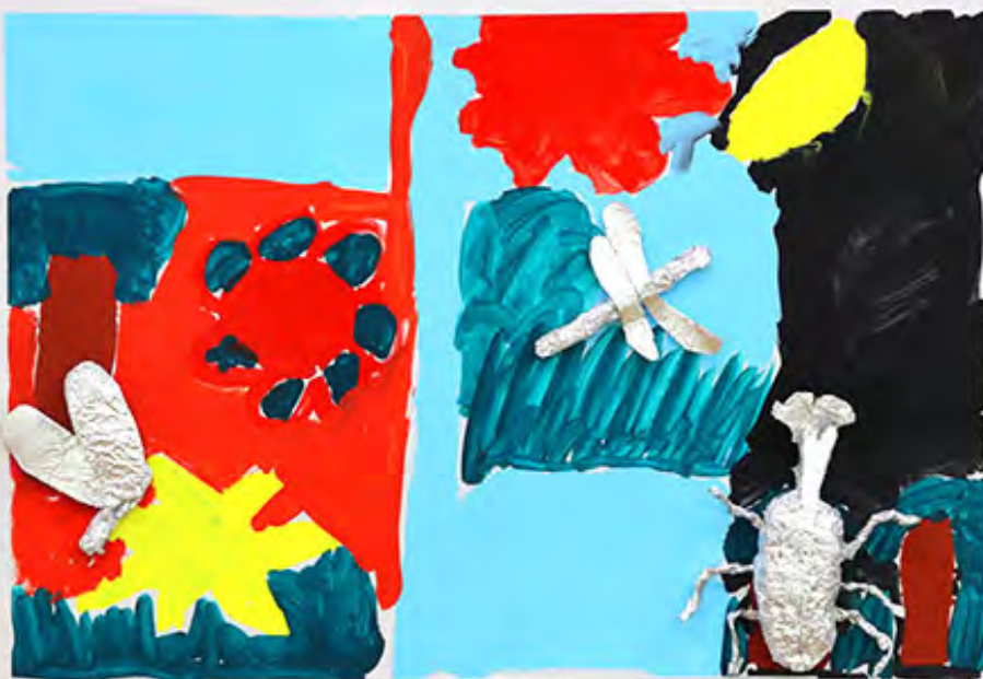
3年 朝と昼と夜の虫たち