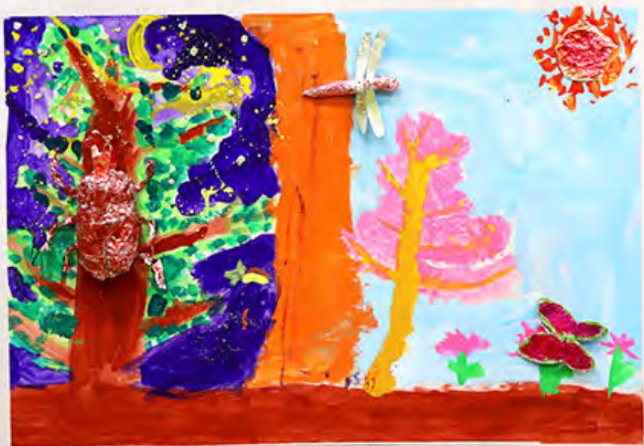
3年 こんちゅうの町