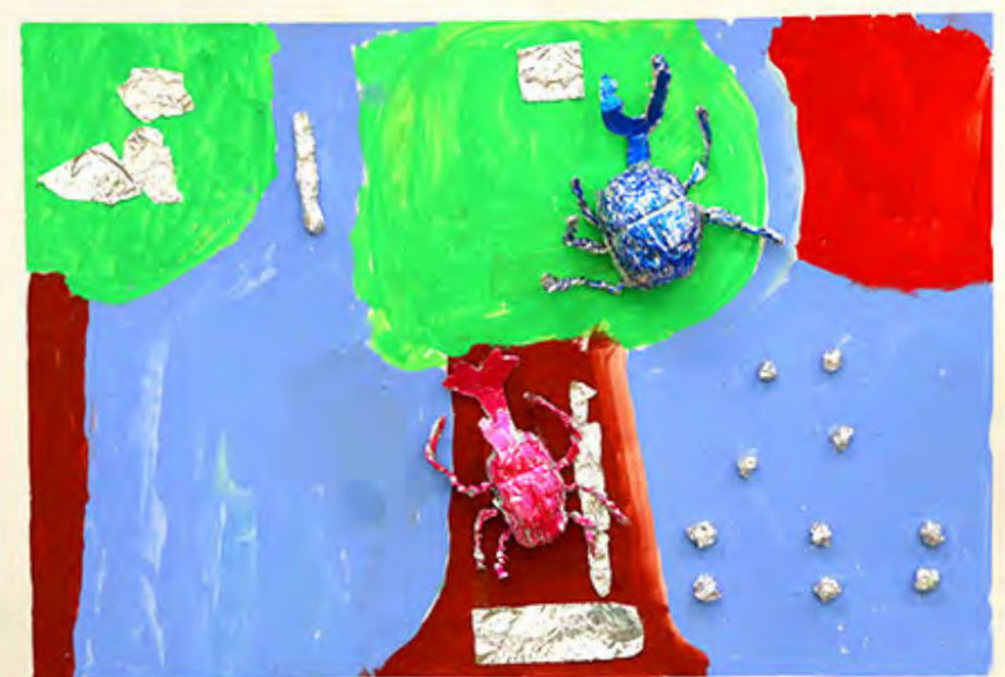
3年 カガムシクワガタ