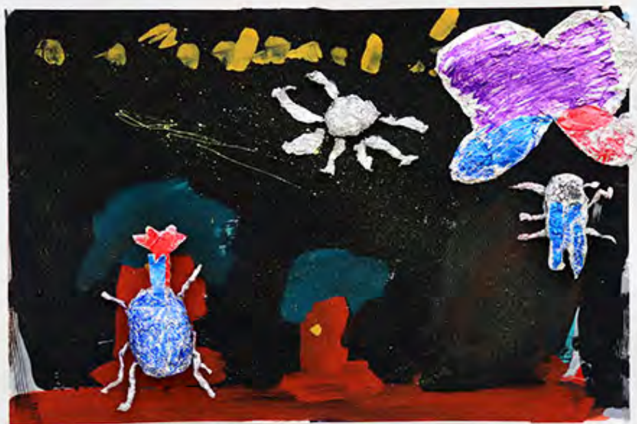
3年 星が出る夜の虫