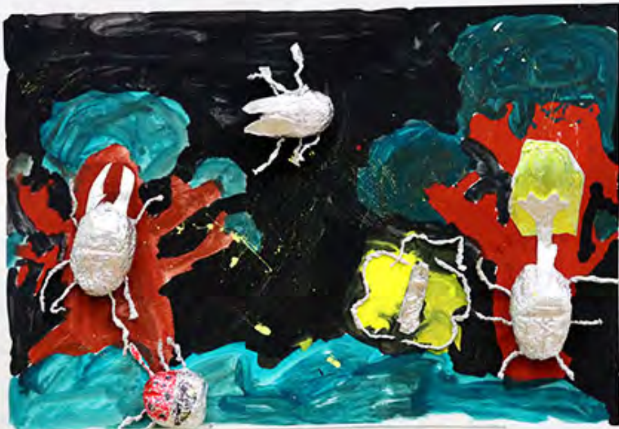
3年 夜にいるこん虫たち