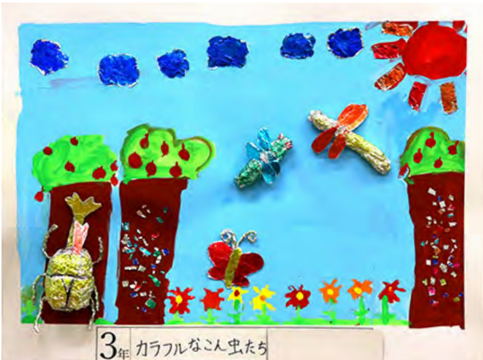
3年 カラフルなこん虫たち