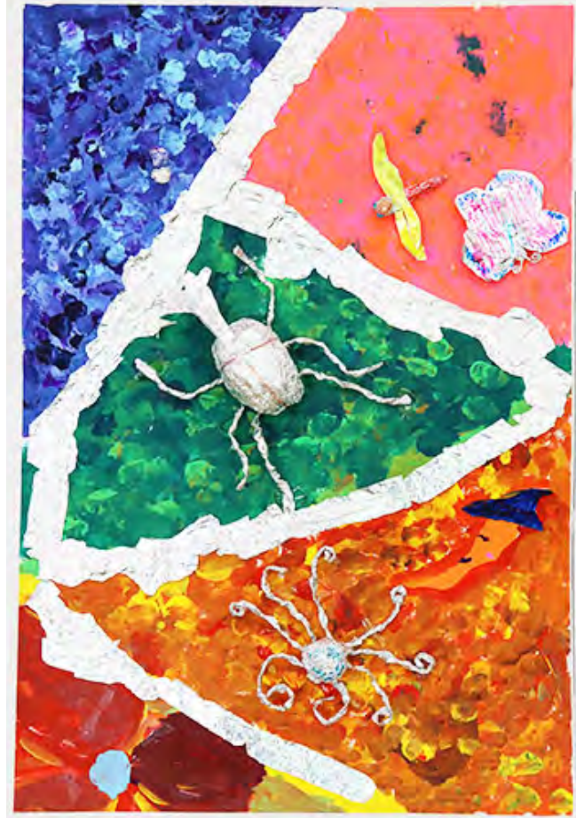
3年 色とりどりの四季