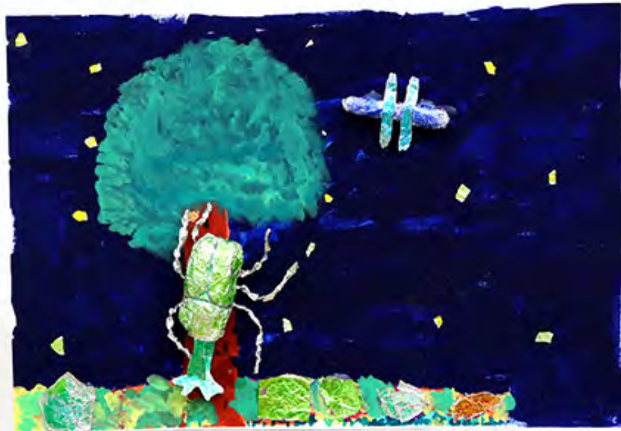
3年 木のしるをなめるカブト虫