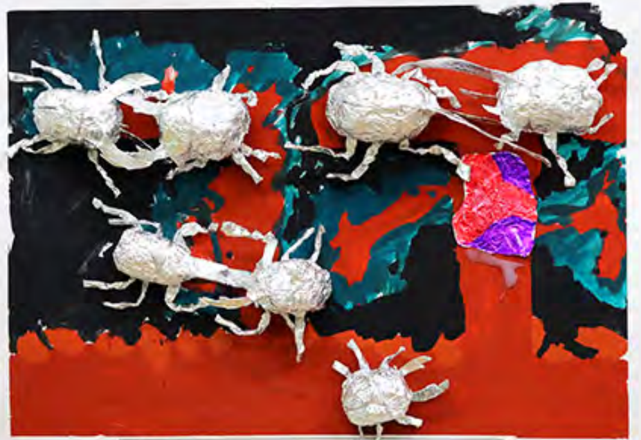
3年 けんかするカゲトクガタ