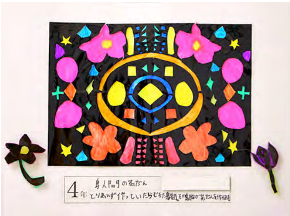
■とりあえず作っていたらできた鳥人間。その鳥人間が花だんを作りました。