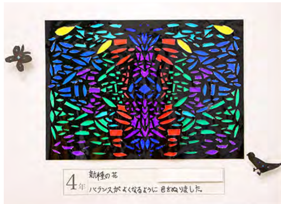
■バランスがよくなるように色をぬりました。