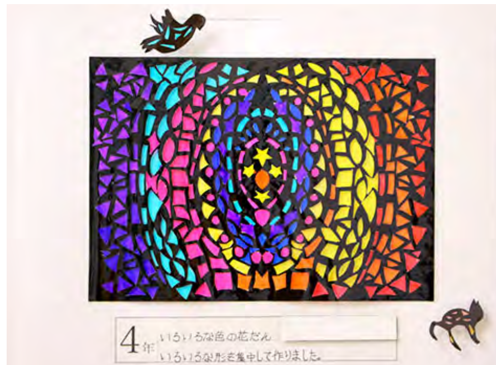
■いろいろな形を集中して作りました。