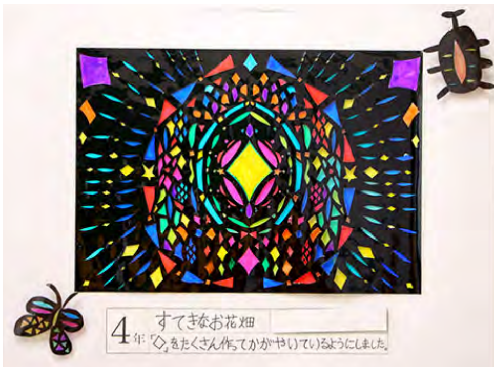
■「◇」をたくさん作ってかがやいているようにしました。