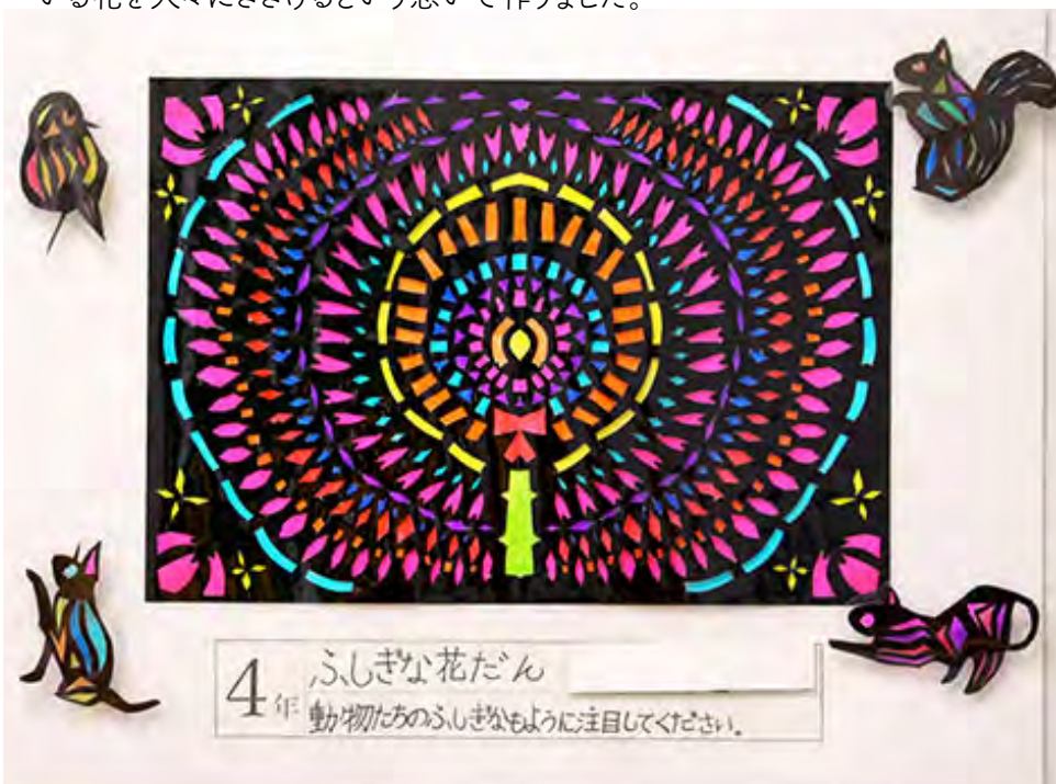
■動物たちのふしぎなもように注目してください。