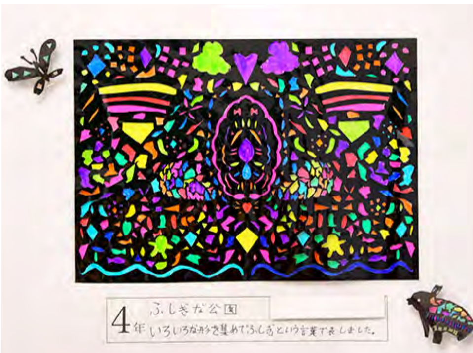
■いろいろな形を集めて「ふしぎ」という言葉で表しました。