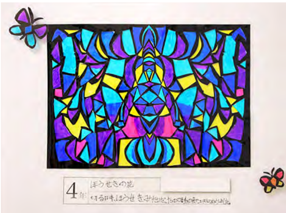
■切る時、ほうせきみたいだったので、青系の色で、工夫してぬりました。