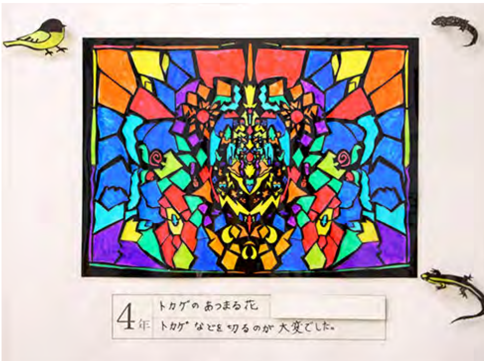
■トカゲなどを切るのが大変でした。