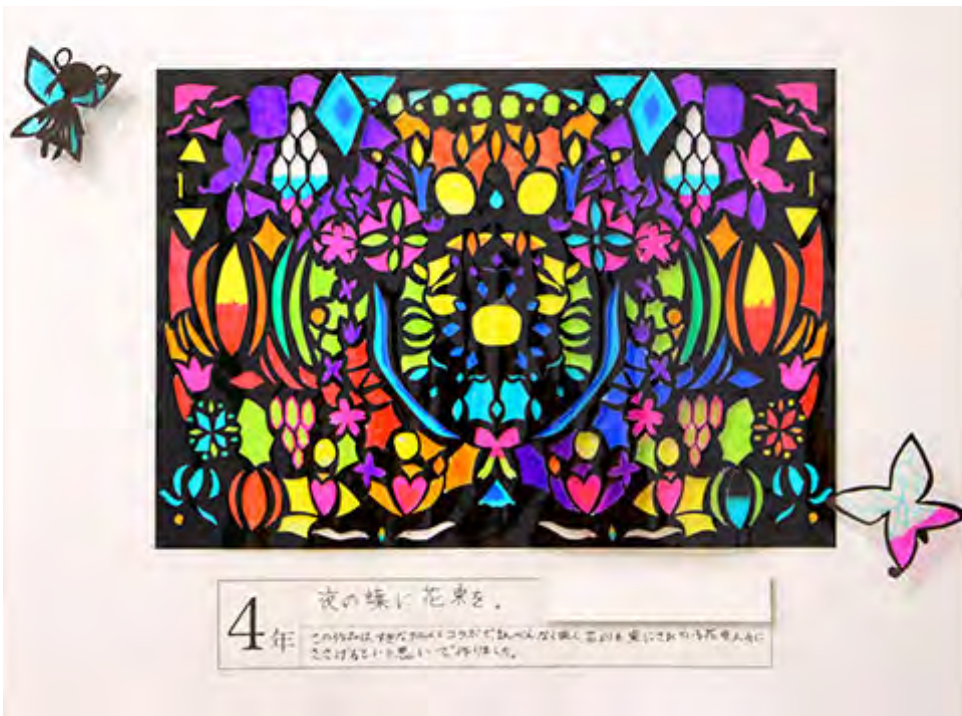
■この作品は、好きなアニメとコラボで、まんべんなく咲く、花よりも、束にされている花を人々にささげるといふ思いで作りました。