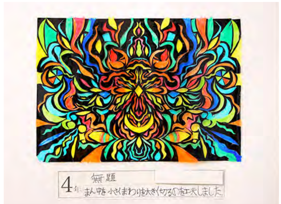
■まん中を小さくまわりを大きく切るのを工夫しました。