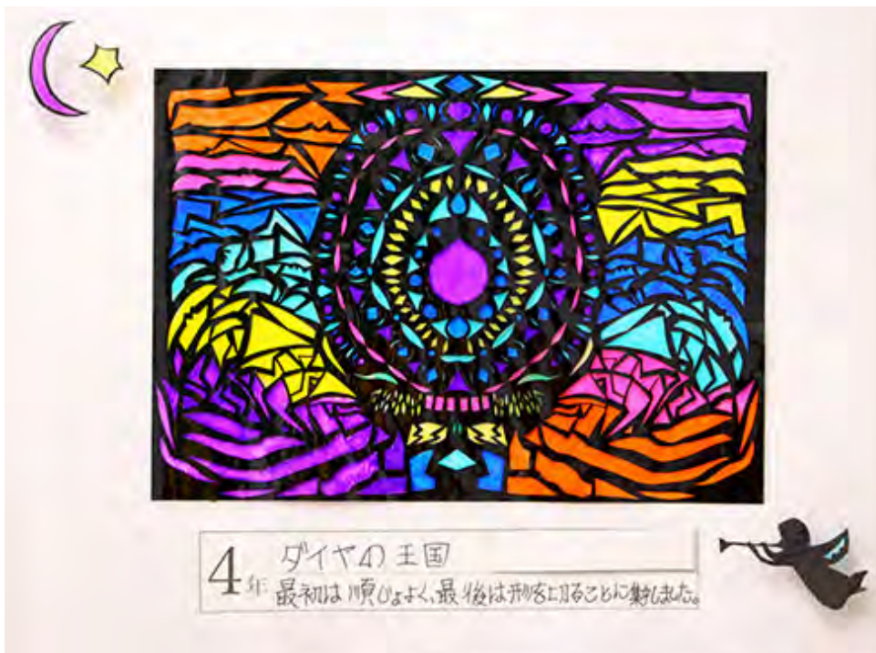
■最初は順じょよく、最後は形を切ることに集中しました。