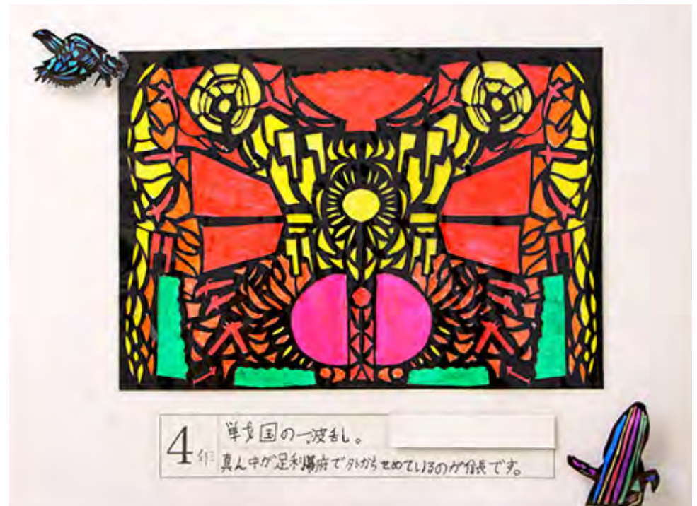
■真ん中が足利幕府で外からせめているのが信長です。