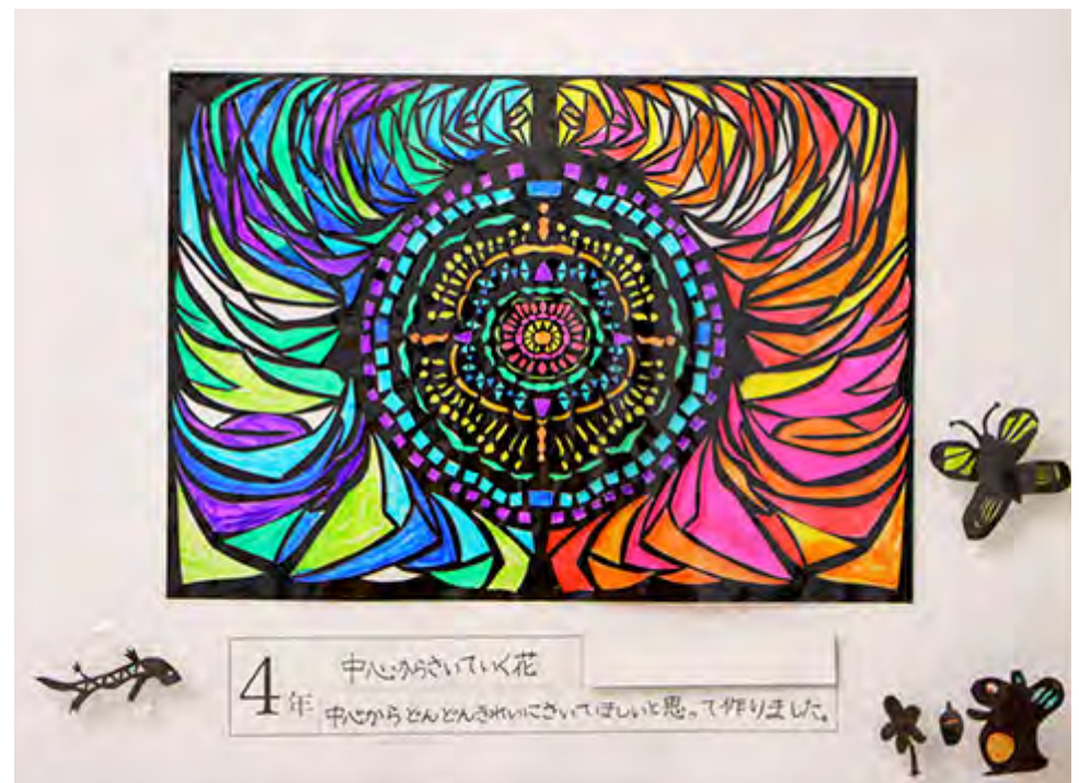
■中心からとんとんきれいにさいてほしいと思つて作りました。