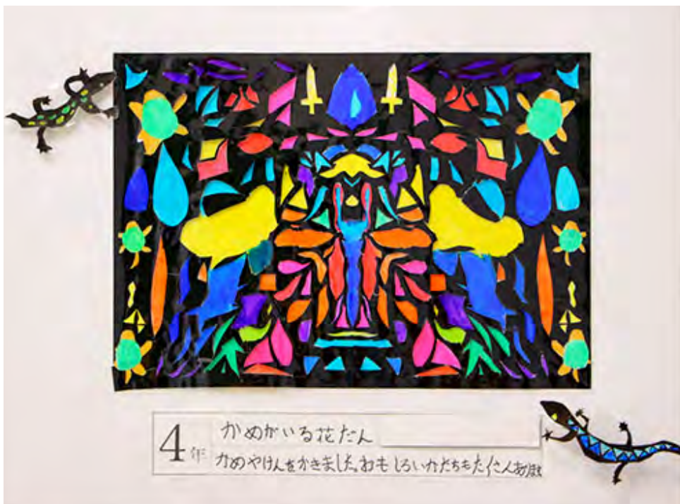
■かめやけんをかきました。おもしろいかたちもたくさんあります。