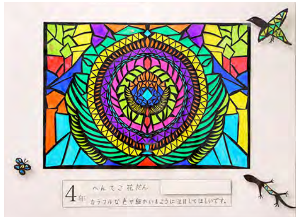
■カラフルな色や細かいもように注目してほしいです。