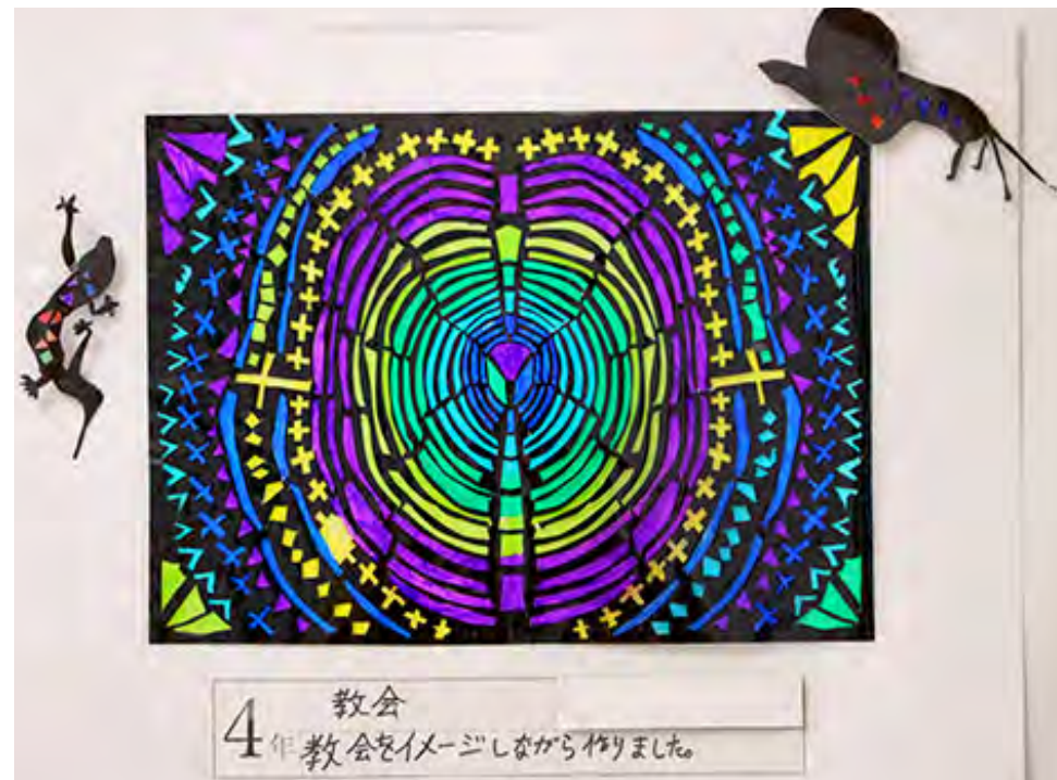
■教会をイメージしながら作りました。