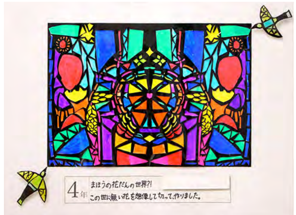
■この世に無い花を想像して切って、作りました。