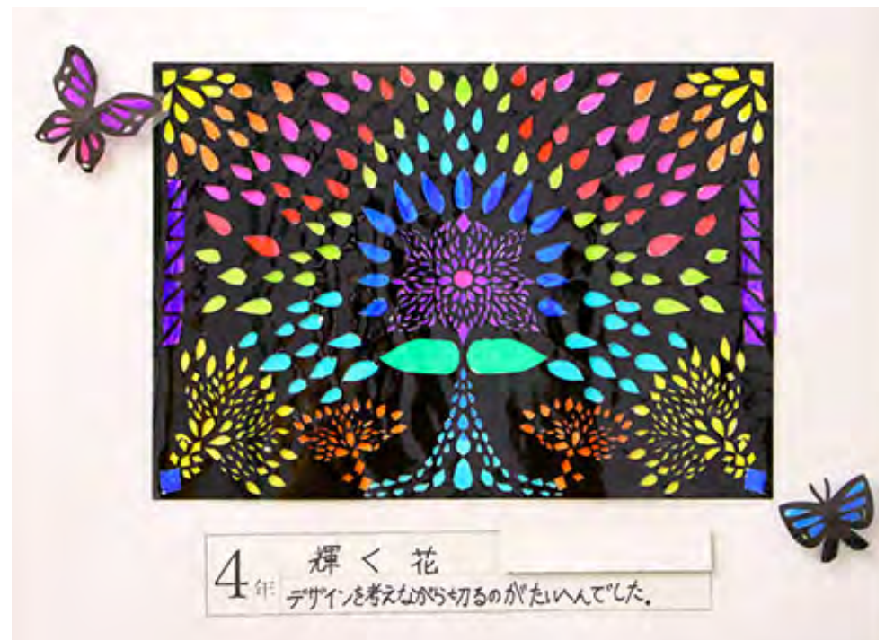
■デザインを考えながら切るのがたいへんでした。