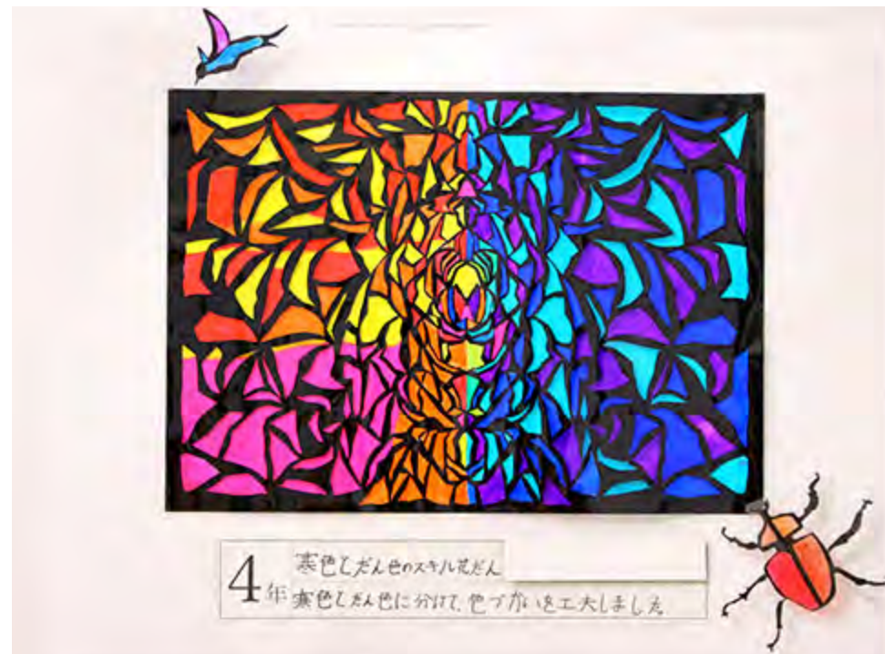
■寒色とだん色に分けて、色づかいを工夫しました。