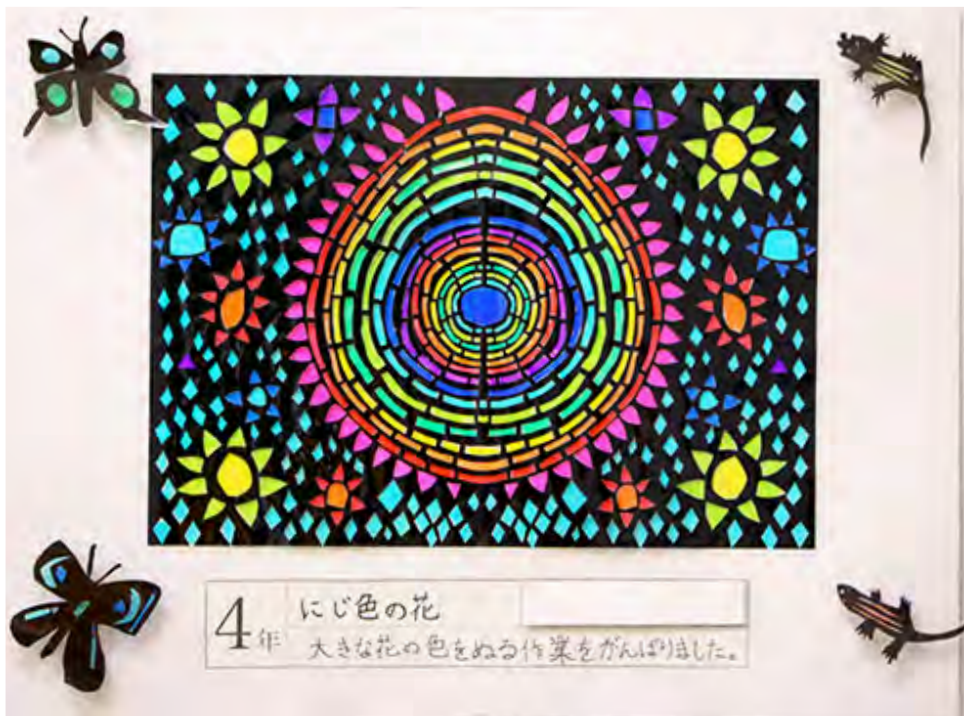
■大きな花の色をぬる作業をがんばりました。