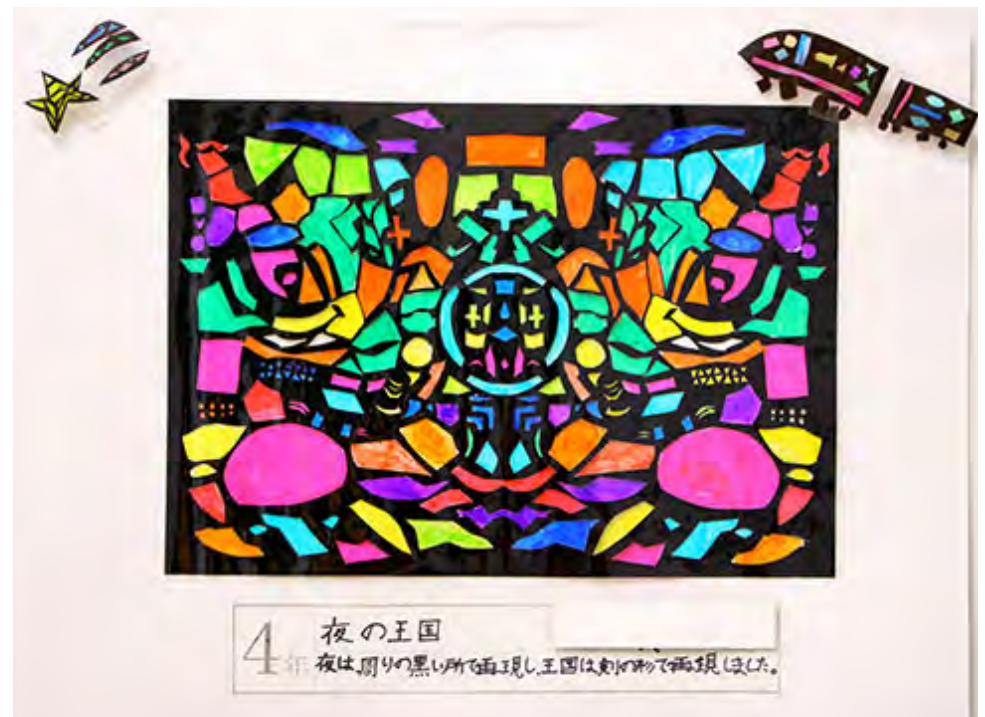
■夜は、周りの黒い所で再現し、王国は、剣の形で再現しました。