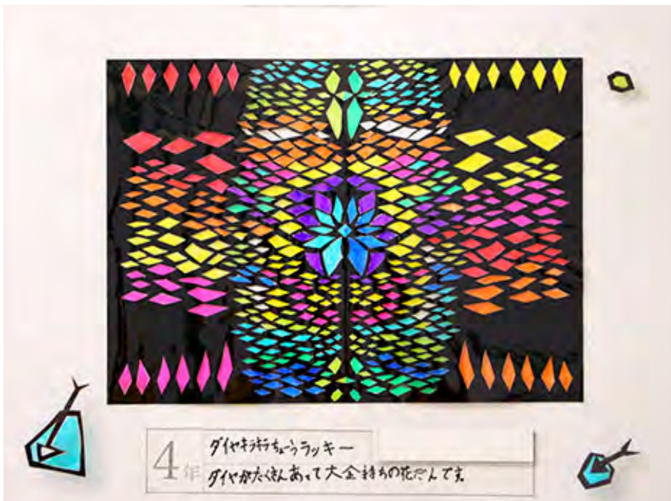
■ダイヤがたくさんあって大金持ちの花だんです。