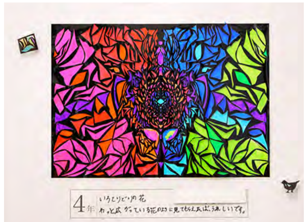
■わっと広がっている花のようになってもらえれば、うれしいです。