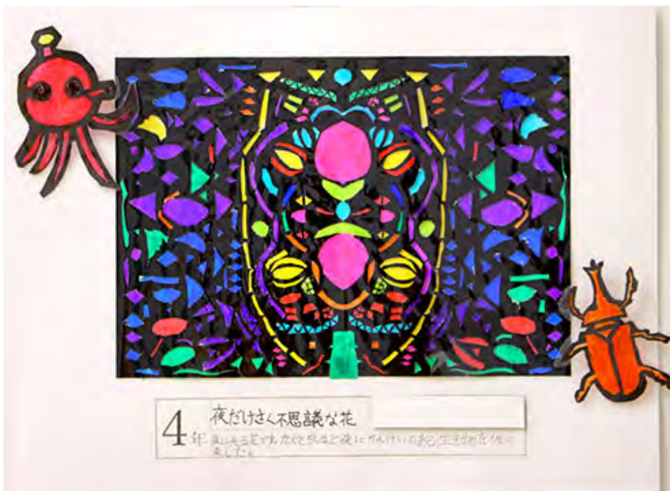
■夜に光る花です。かぶと虫など夜にかんけいのある生き物を作りました。