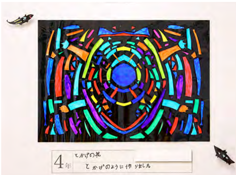
■とかげのように作りました。