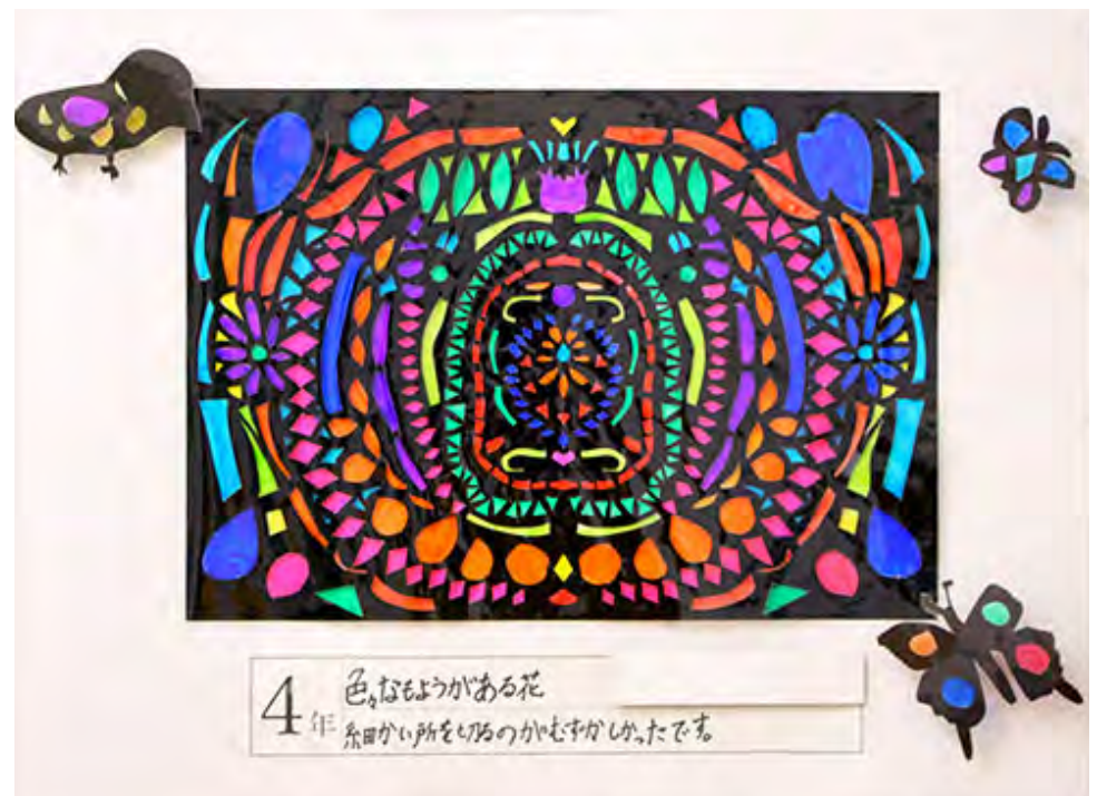
■細かい所を切るのがむずかしかったです。