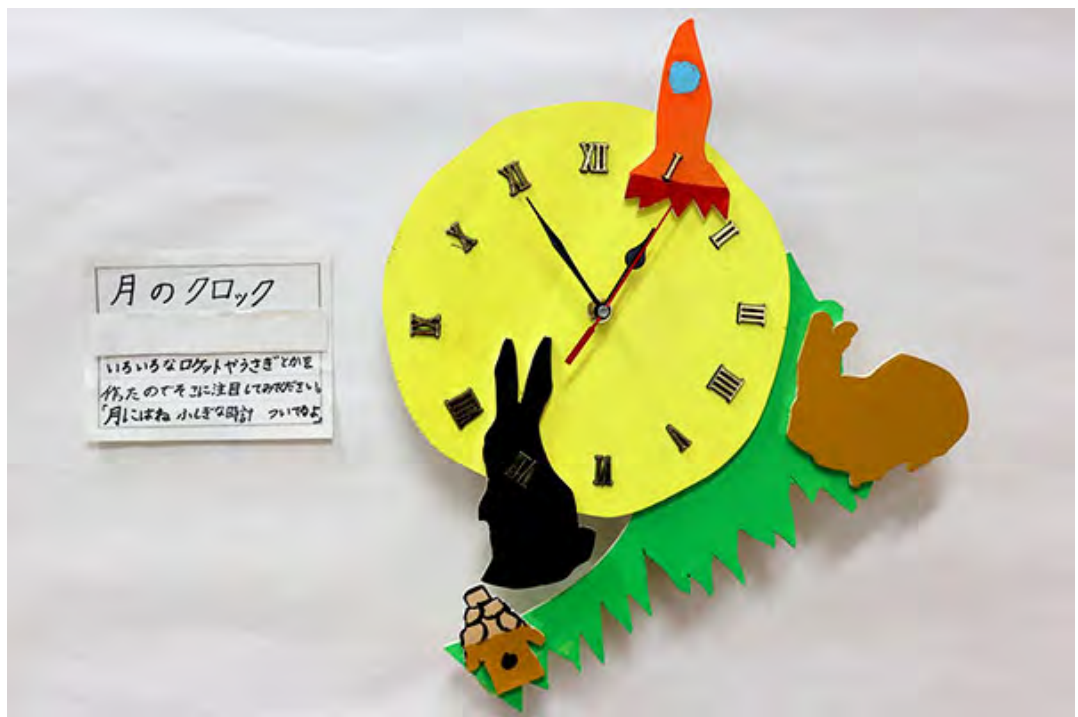
■いろいろなロケットやうさぎとかを作ったのでそこに注目してみてください。 「月にはね ふしぎな時計 ついてるよ」