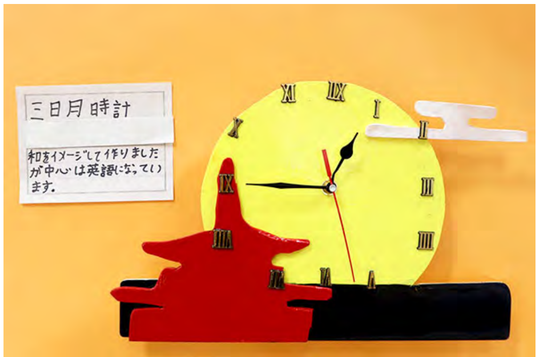
三日月時計 和をイメージして作りましたが中心は英語になっています。