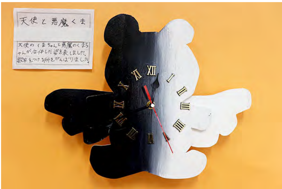
天使と悪魔くま 天使のくまちゃんと悪魔のくまちゃんが合体した姿を表しました。数字をつける所をがんばりました。