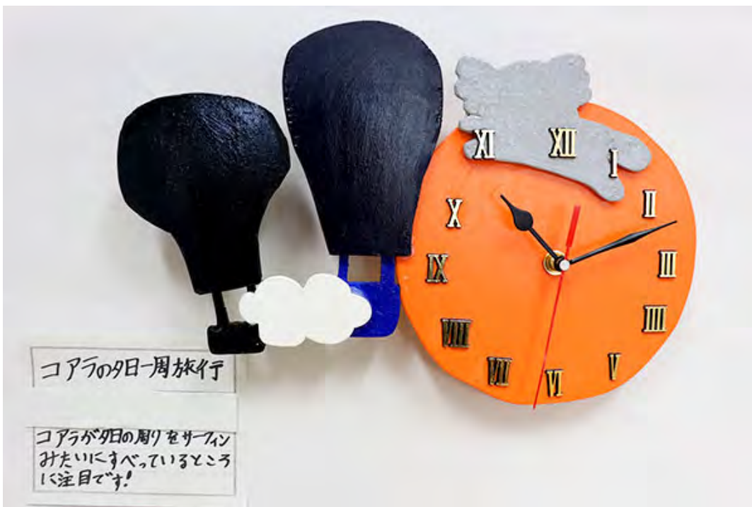
■コアラが夕日の周りをサーフィンみたいにしていて、そこを注目で!