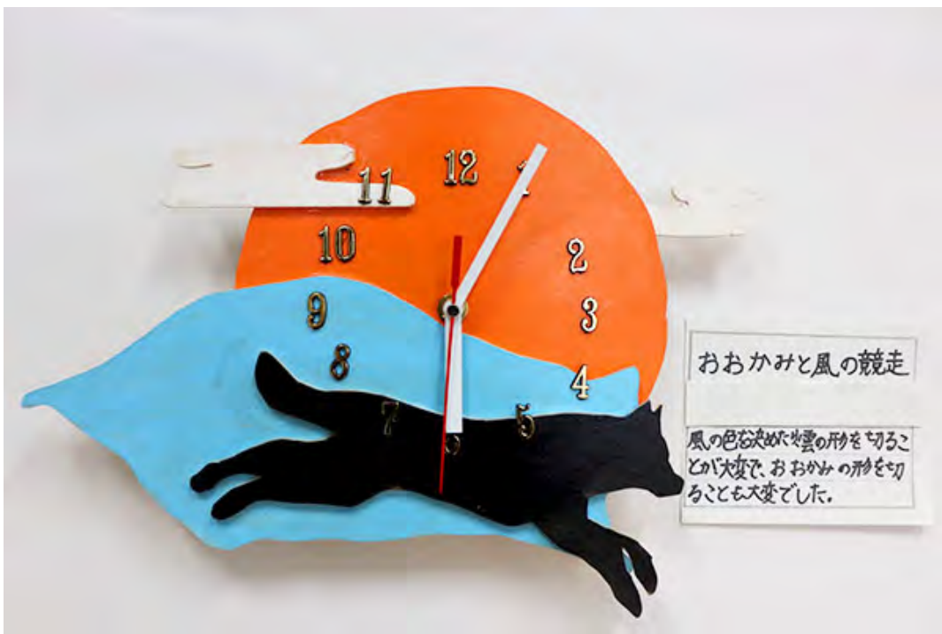
■風の色を決めたり、雲の形を切ることが、大変で、おおかみの形を切ることも、大変でした。