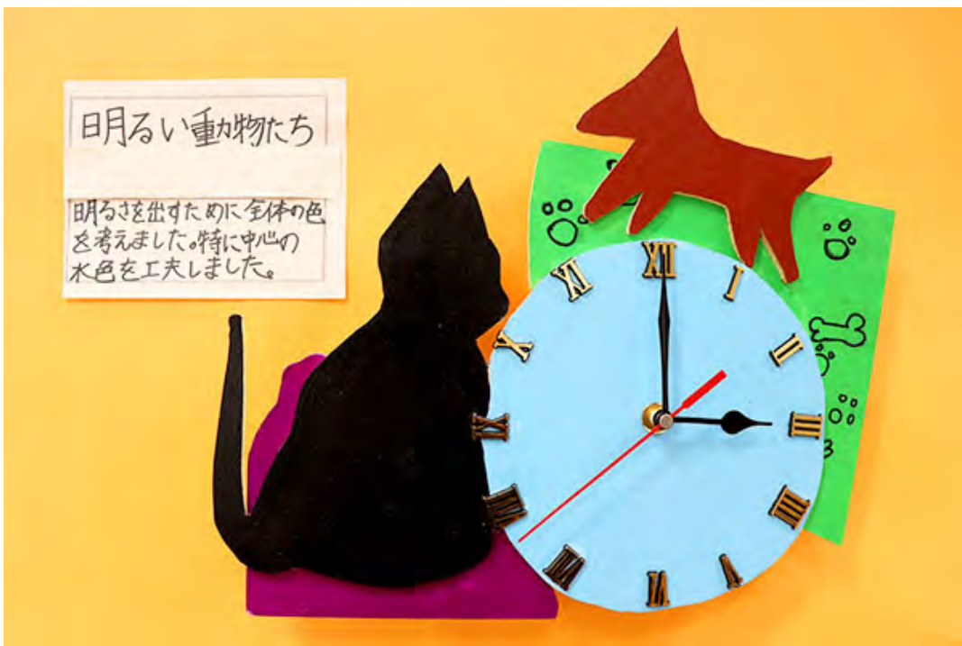
■明るさを出すために全体の色を考えました。特に中心の水色を工夫しました。