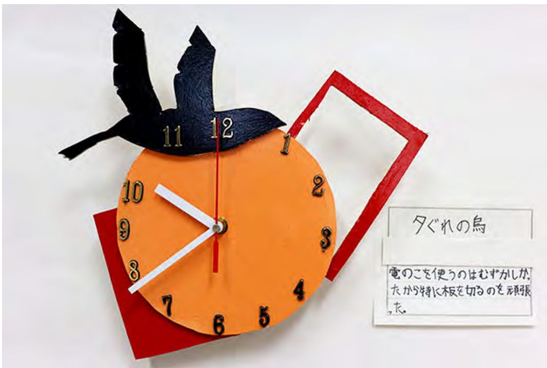
夕ぐれの鳥 電のこを使うのはむずかしかったから特に板を切るのを頑張った。