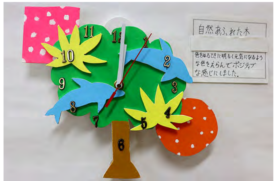
■色をぬるときに明るく元気になるような色をえらんでポジティブな感じにしました。