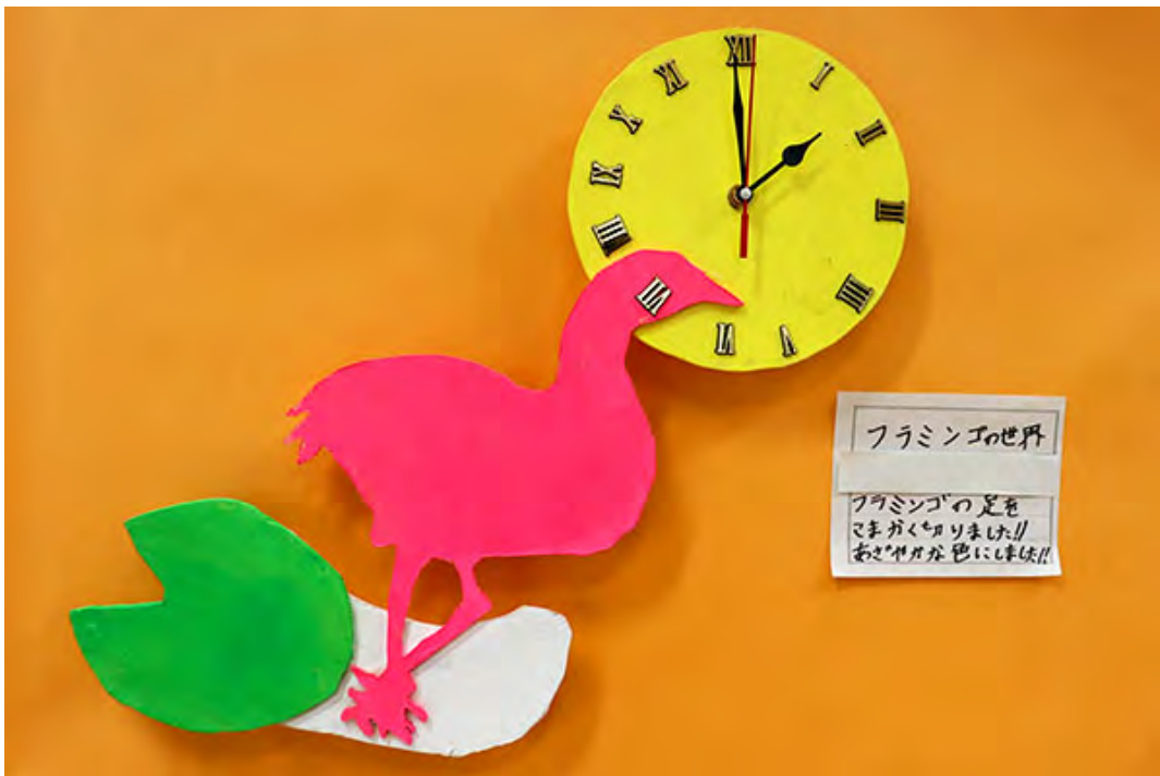
■フラミンゴの足をこまかく切りました!!あざやかな色にしました!!