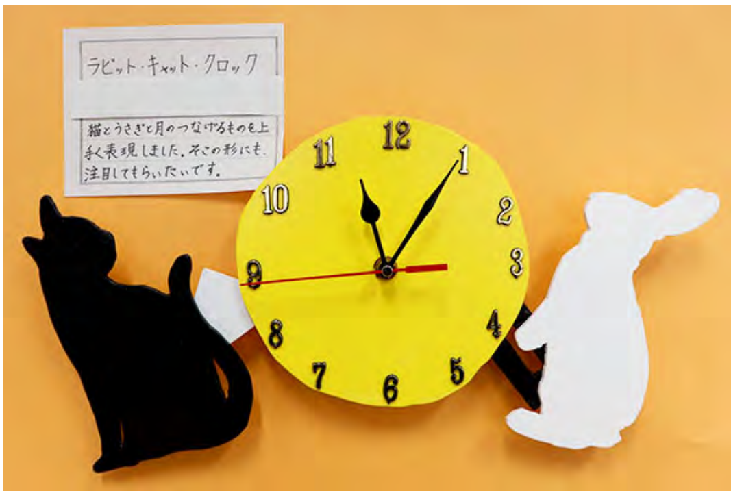
■猫とうさぎと月のつなげるものを上手く表現しました。その形にも、注目してもらいたいです。