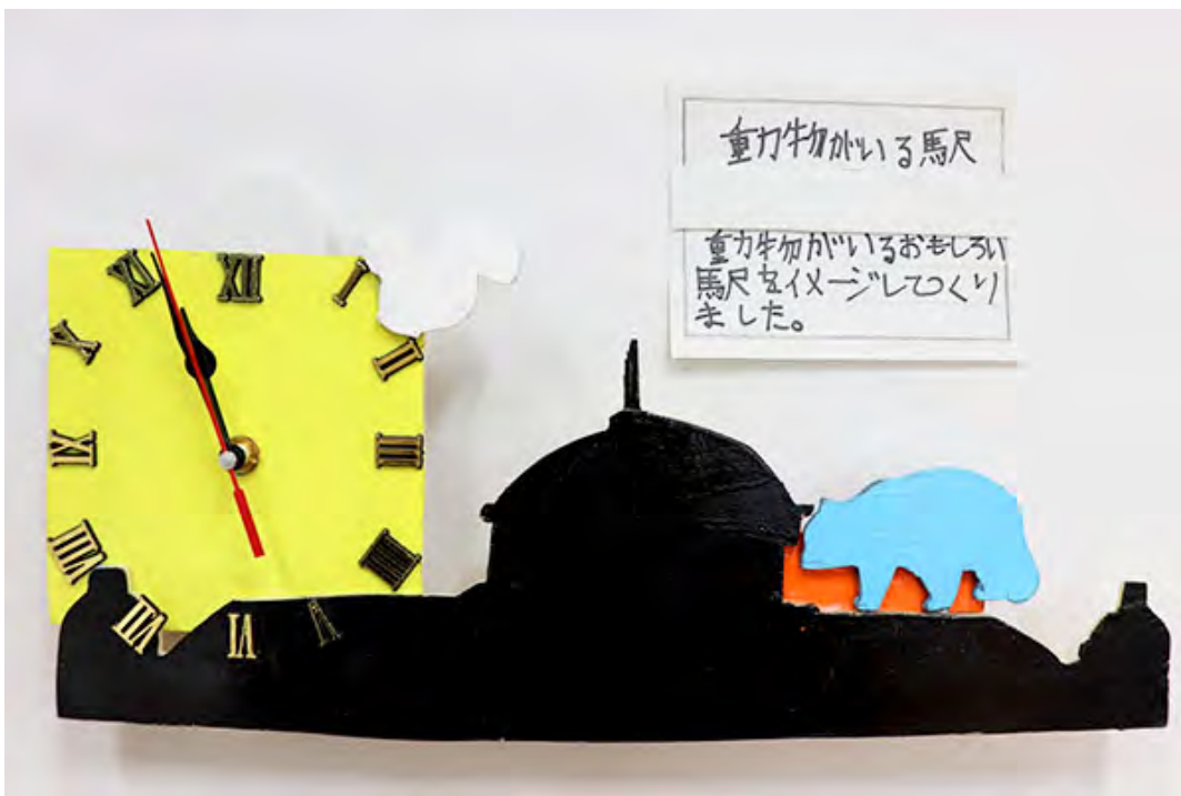
■動物がいるおもしろい駅をイメージしてつくりました。