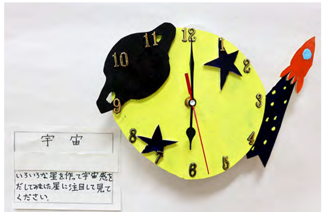
■いろいろな星を作って宇宙感をだしてみました。星に注目して見てください。