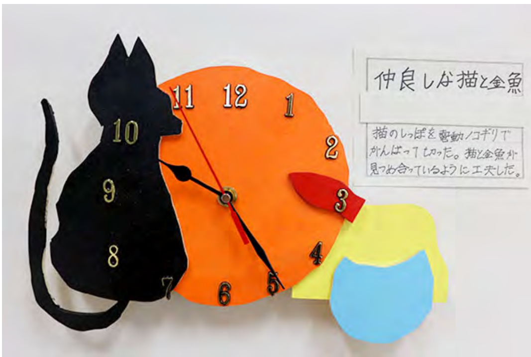
■猫のしっぽを電動ノコギリでがんばって切った。猫と金魚が見つめ合っているように工夫した。