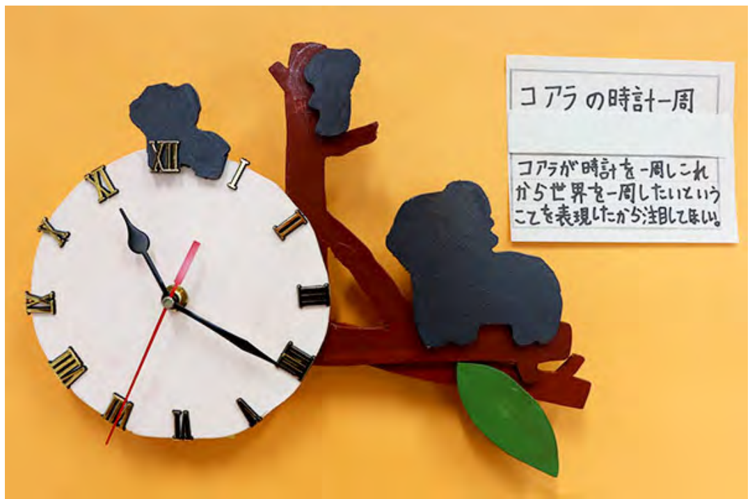
■コアラが時計を一周しこれから世界を一周したいということを表現したから注目してほしい。