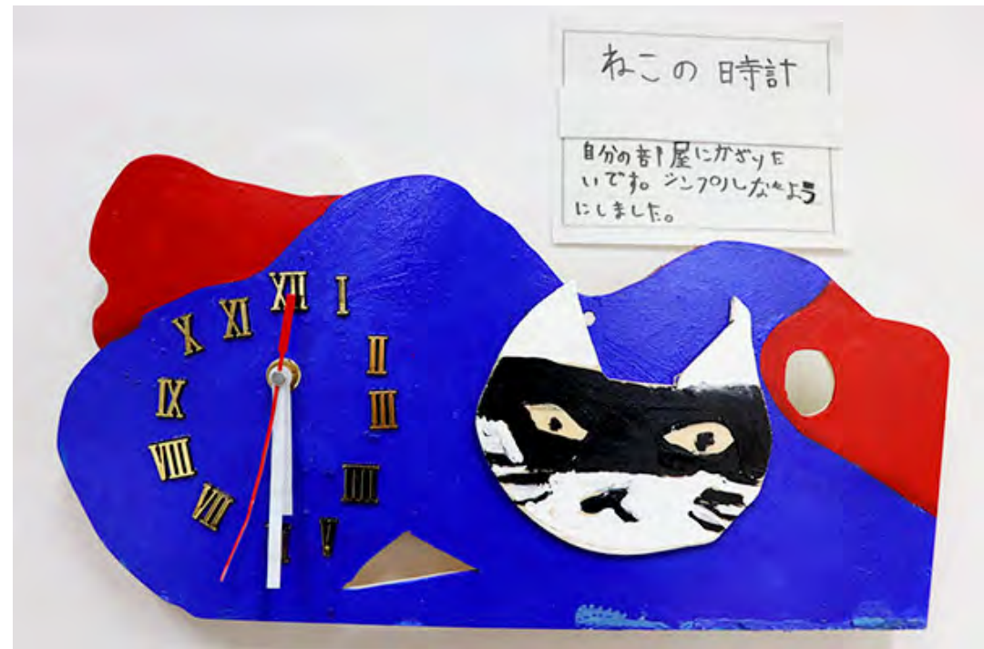
■自分の部屋にかざりたいです。シンプルなものにしました。