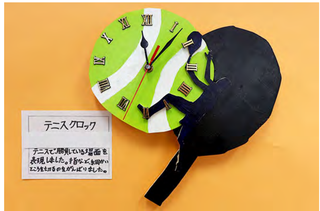
■テニスで、勝負している場面を表現しました。指など、細かいところを切るのをがんばりました。