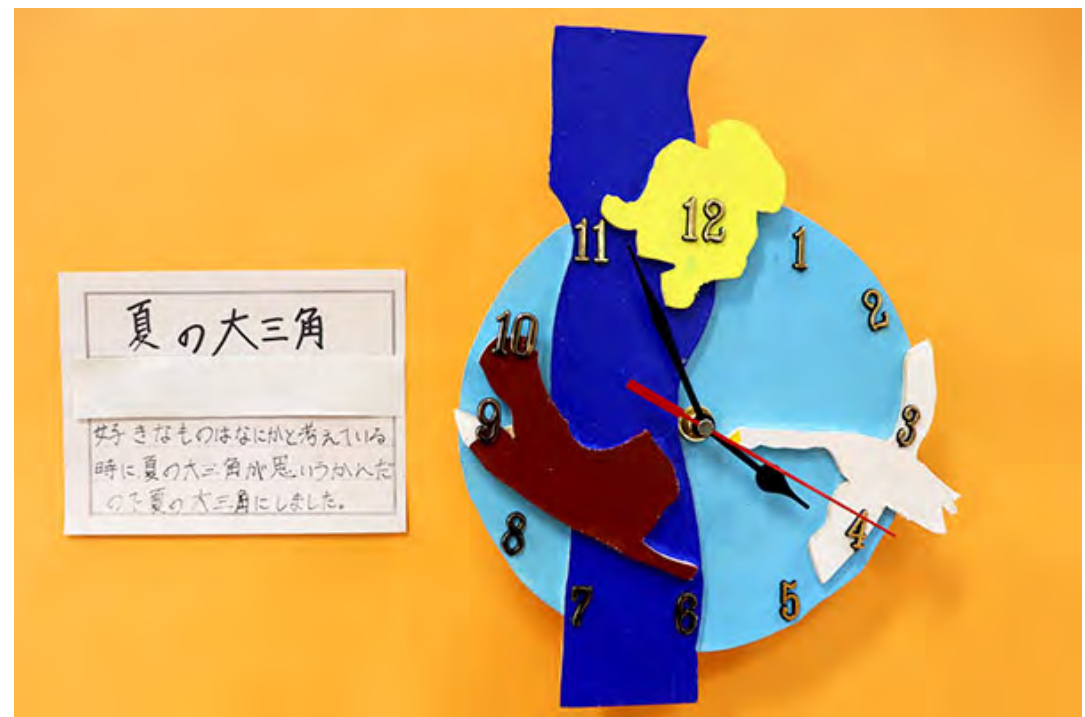
■好きなものはなにかと考えている時に、夏の大三角が思いついたので夏の大三角にしました。