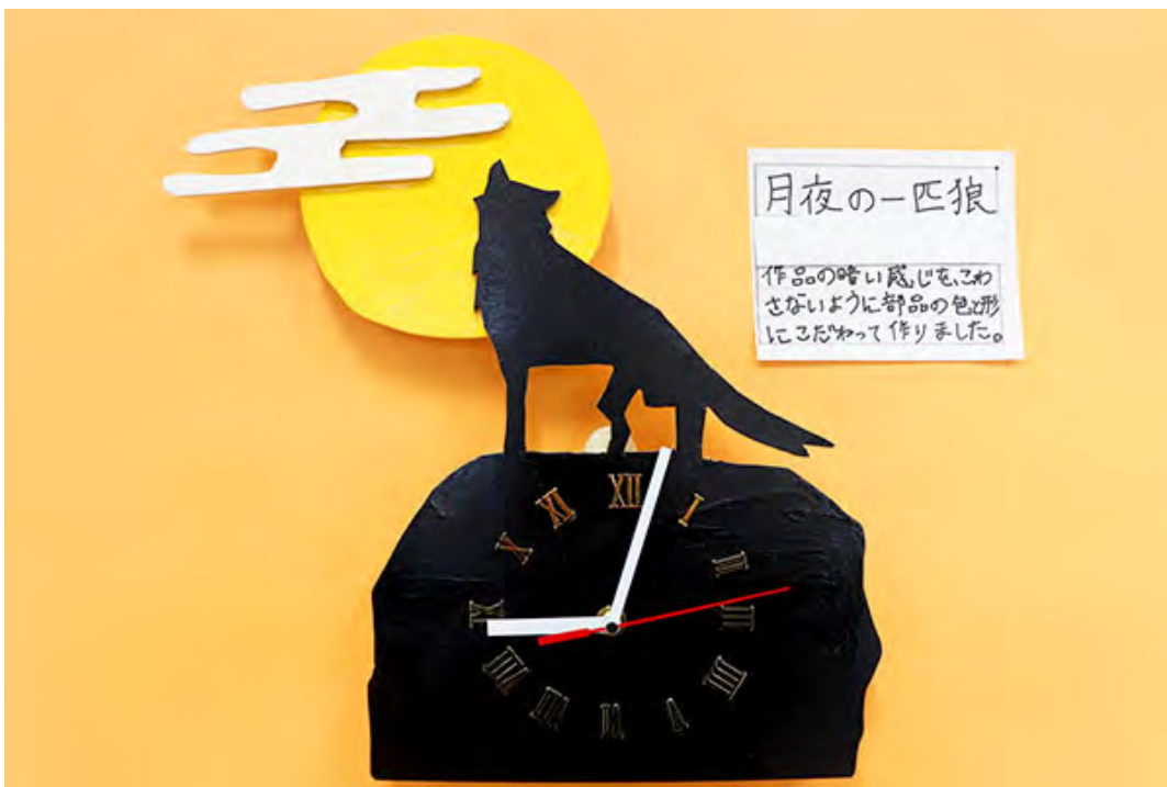
■作品の暗い感じを、こわさないように部品の色と形にこだわって作りました。