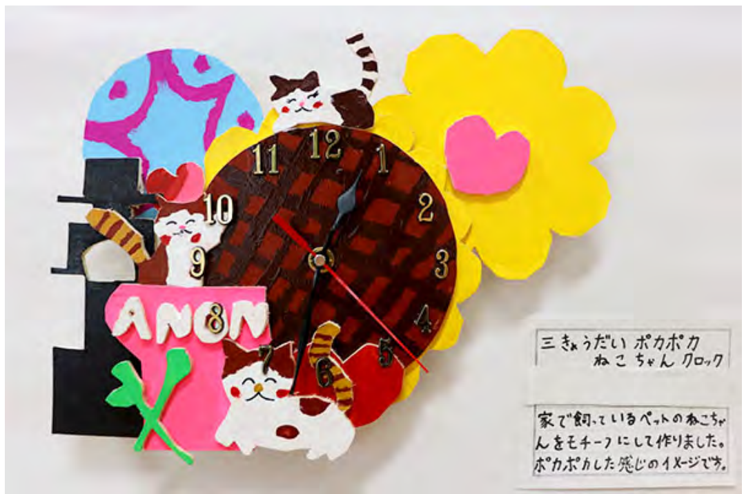
■家で飼っているペットのねこちゃんをモチーフにして作りました。ポカポカした感じのイメージです。