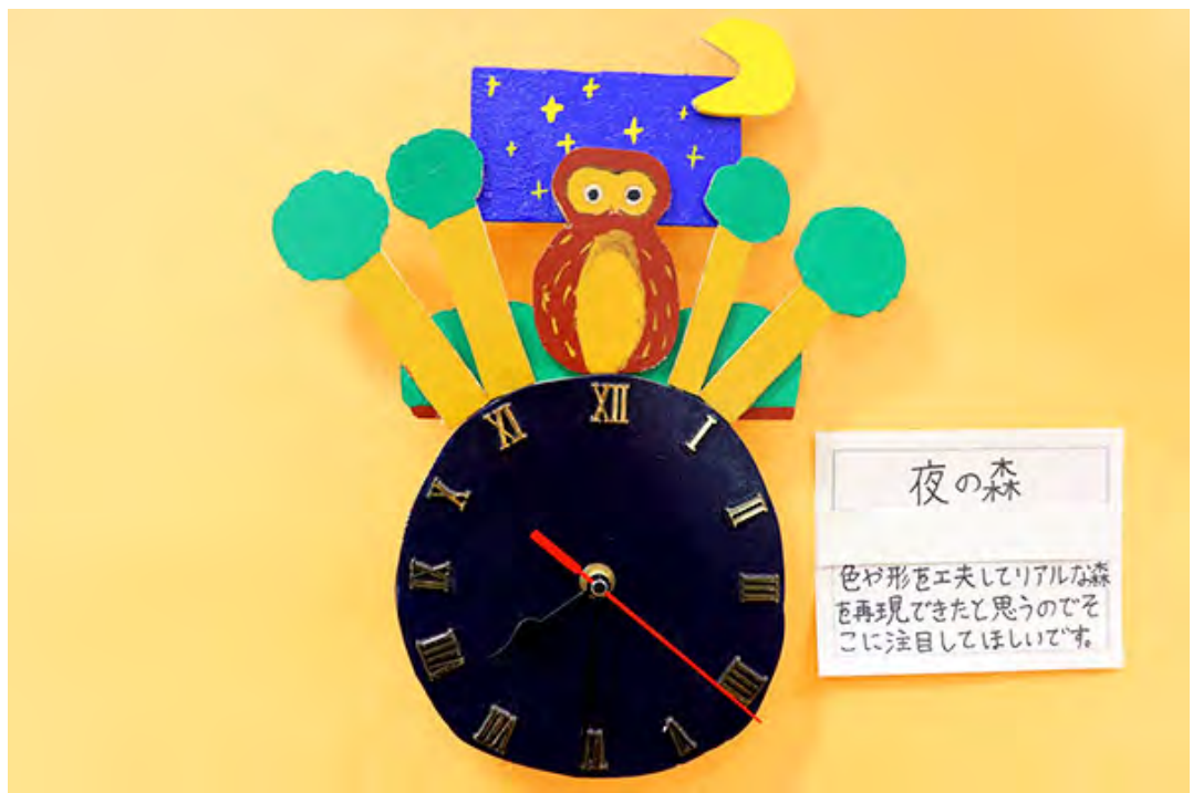
■色や形を工夫してリアルな森を再現できたと思うのでそこに注目してほしいです。