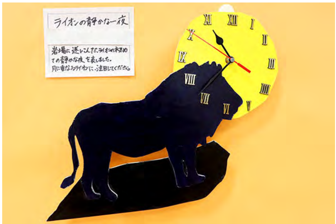
ライオンの静かな一夜 岩場に迷い込んだライオンの初めての静かな夜を表しました。月に重なるライオンに、注目してください。