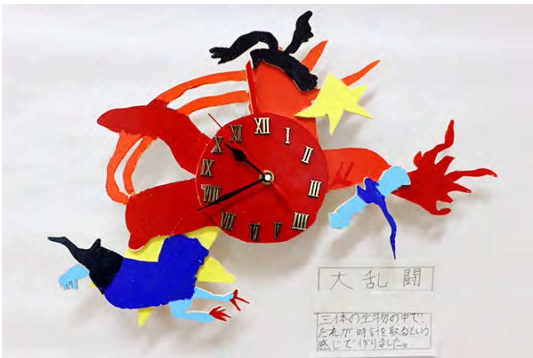
■三体の生物の中で、だれが、時計を取るという感じで作りました。