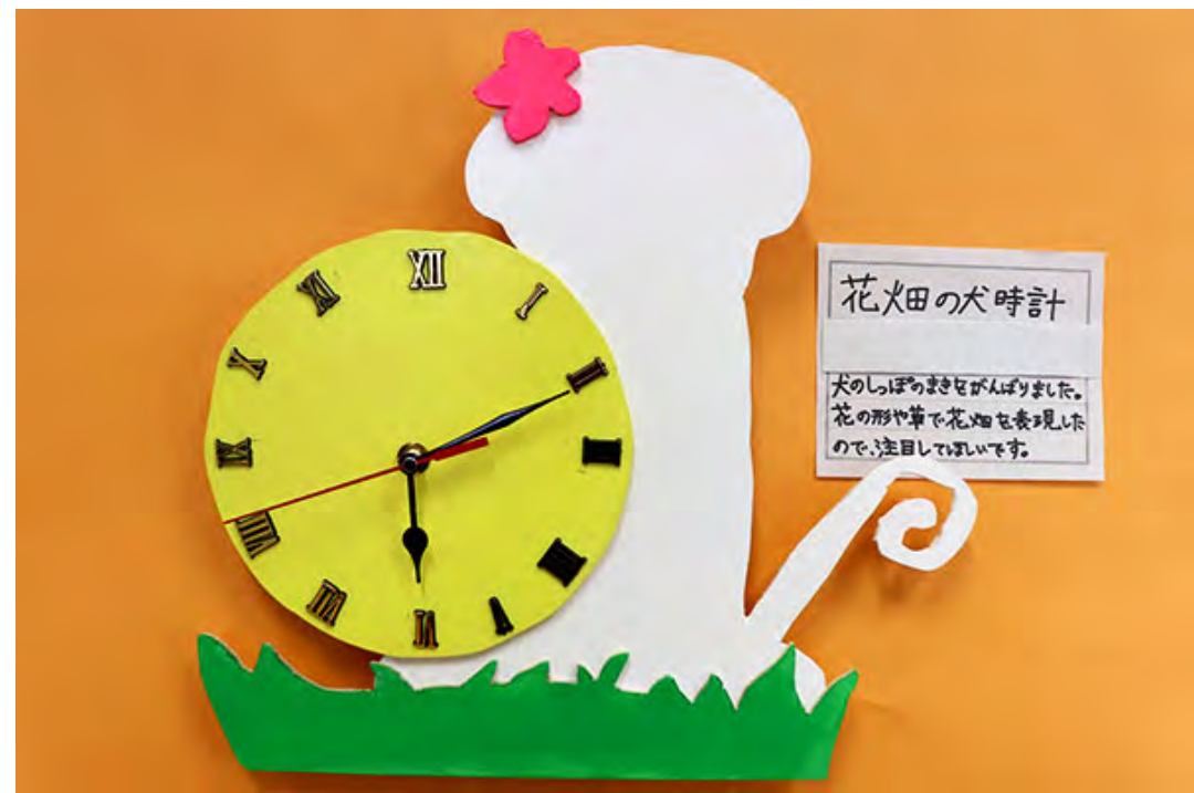
■犬のしっぽのまきをがんばりました。花の形や草で花畑を表現したので、注目してほしいです。