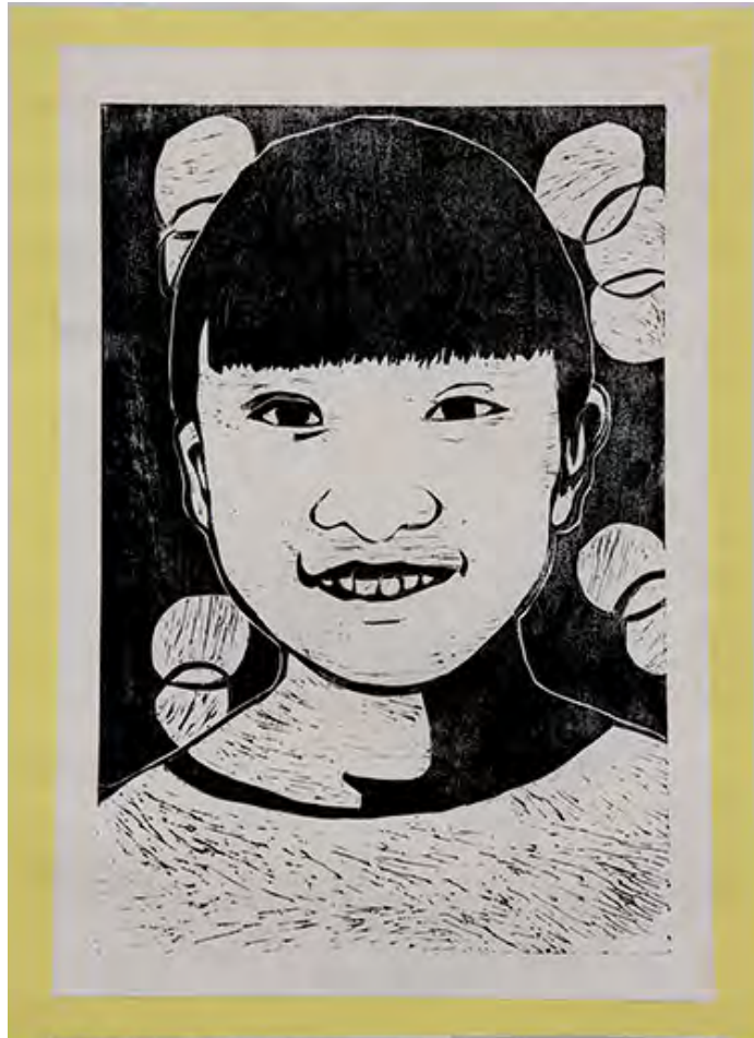
6年 自分 前髪をほるのが、とても難しかったけど、慎重にほれたので、きれいにできました。

■一番大変だったところはかみの毛の部分です。まゆげとかみの毛のスペースがないところは三角刀でほりましたが、細かくてほりにくかったです。けど、一番楽しかったです。