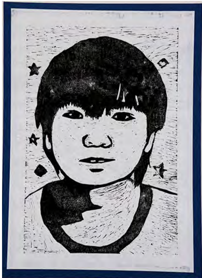
6年 モノクロの自分 背景をきれいに写すのが難しかったです。