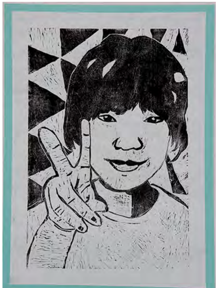
6年 11才の自分 背景の三角は明るさを表し、白黒のバランスを考え、ていねいに ほりました。

■作品のこだわりポイント!! →白目をほる所など細々したところを ていねいにしました。 一言→こんにちば〜。