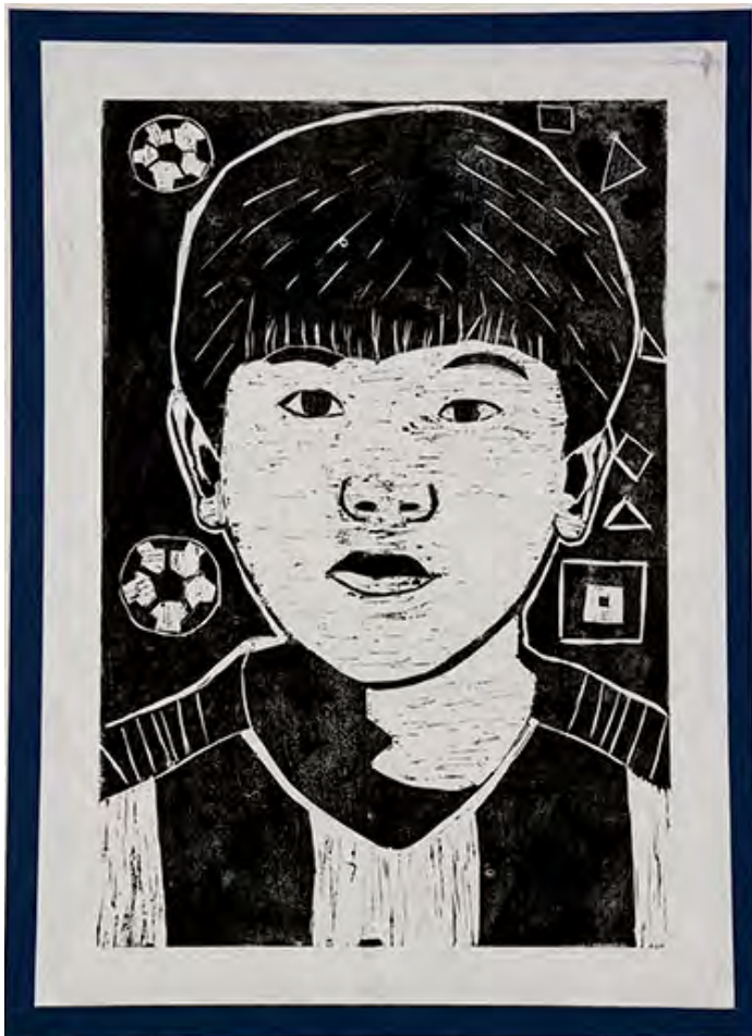
6年 Soccer ball