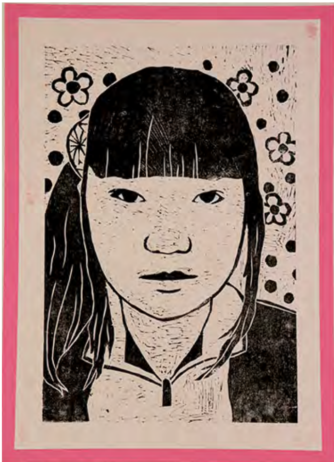
6年 自分らしい自分 目の白目やまつ毛などを自分をさいげんするよう工夫しました。