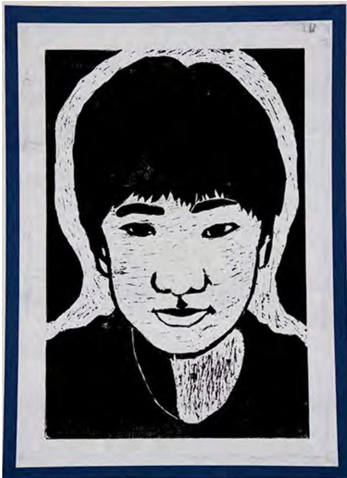
6年 The 自分 一番大変だったところはかみの毛の部分です。まゆげとかみの毛のスペースがないところは三角刀でほりましたが、細かくてほりにくかったです。けど、一番楽しかったです。

■一番大変だったところはかみの毛の部分です。まゆげとかみの毛のスペースがないところは三角刀でほりましたが、細かくてほりにくかったです。けど、一番楽しかったです。