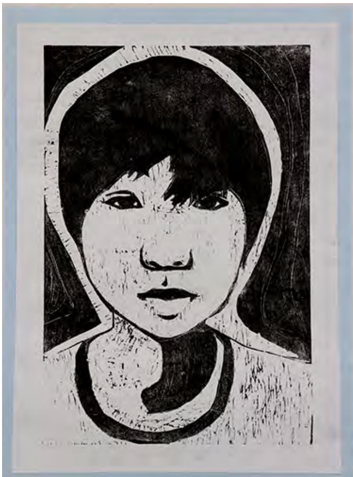
6年 ありのままの自分 作品のこだわりポイント!! →白目をほる所など細々したところを ていねいにしました。 一言→こんにちば〜。

■作品のこだわりポイント!! →白目をほる所など細々したところを ていねいにしました。 一言→こんにちば〜。