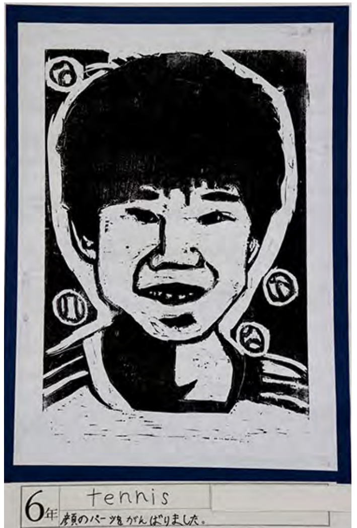
■顔のパーツをがんばりました。