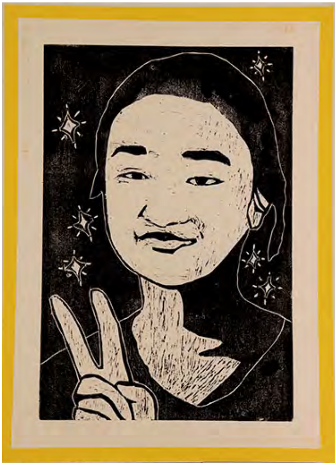
6年 明るい私 大変だったところは背景の星のところ。理由は小さくて、やりにくいからです。