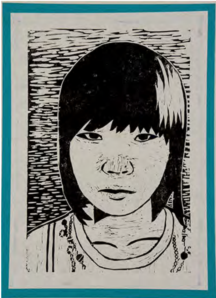
6年 サ・自分 見た通りの自分を表しました。服の模様をがんばってほりました。