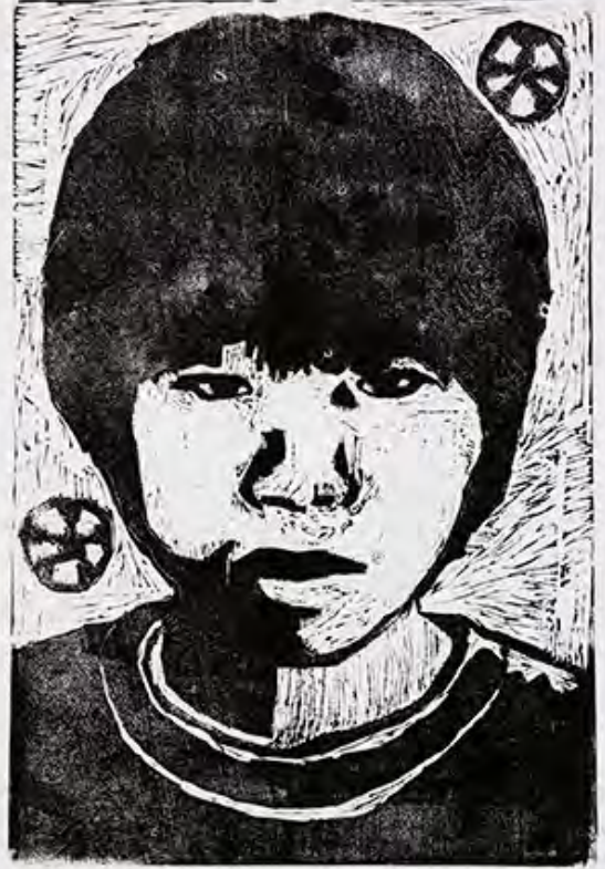
6年 白黒の自分 サッカーボールの白と黒のつくり方が大変でした。