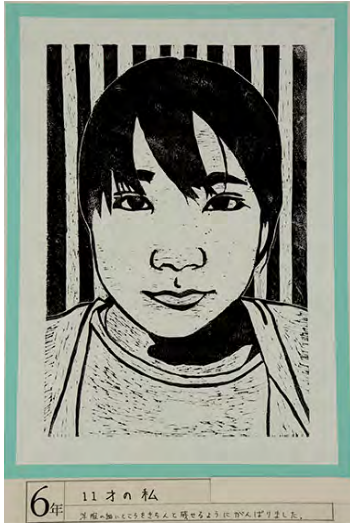
■洋服の細いところをきちんと残せるようにがんばりました。