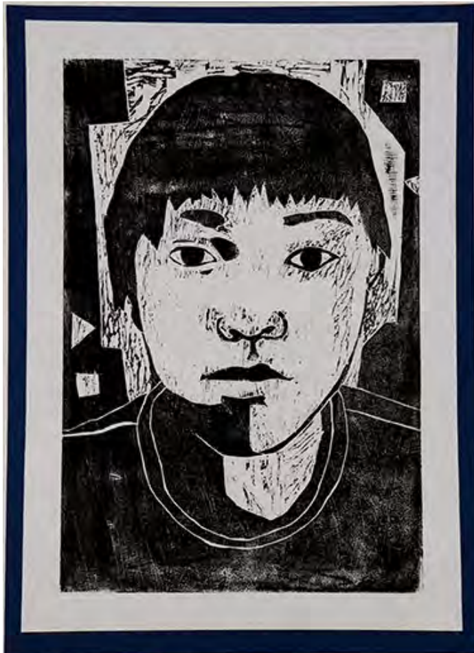
6年 自分 自分の絵だけでなく背景も工夫をしました。

■りんかくをほるのが難しかったです。三角刀でていねいにほったらうまくほれました。