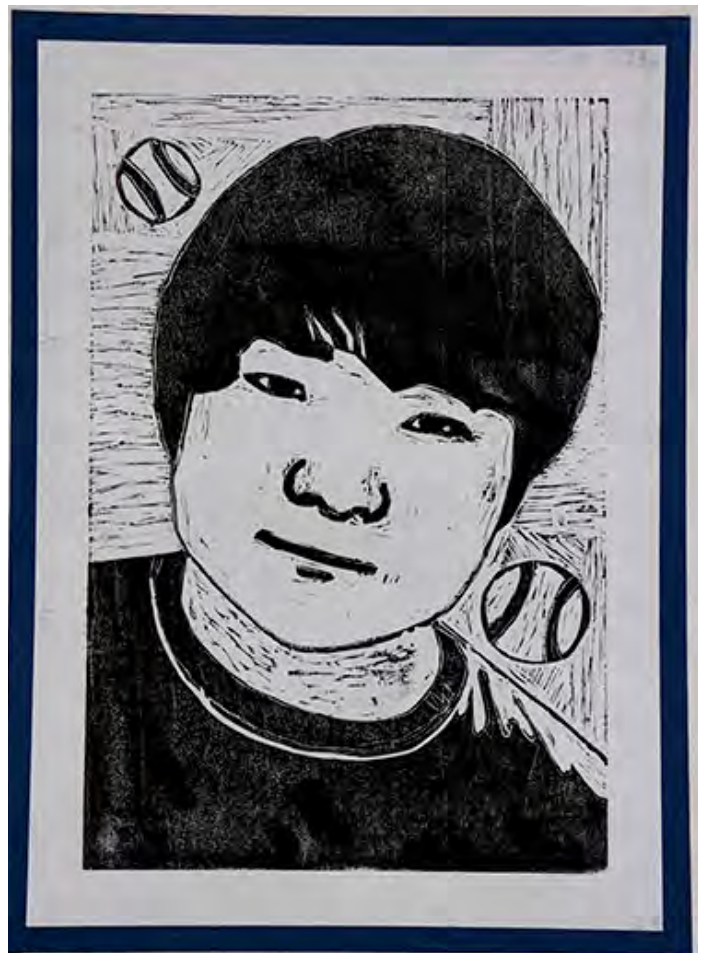
6年 base ball りんかくをほるのが難しかったです。三角刀でていねいにほったらうまくほれました。

■りんかくをほるのが難しかったです。三角刀でていねいにほったらうまくほれました。