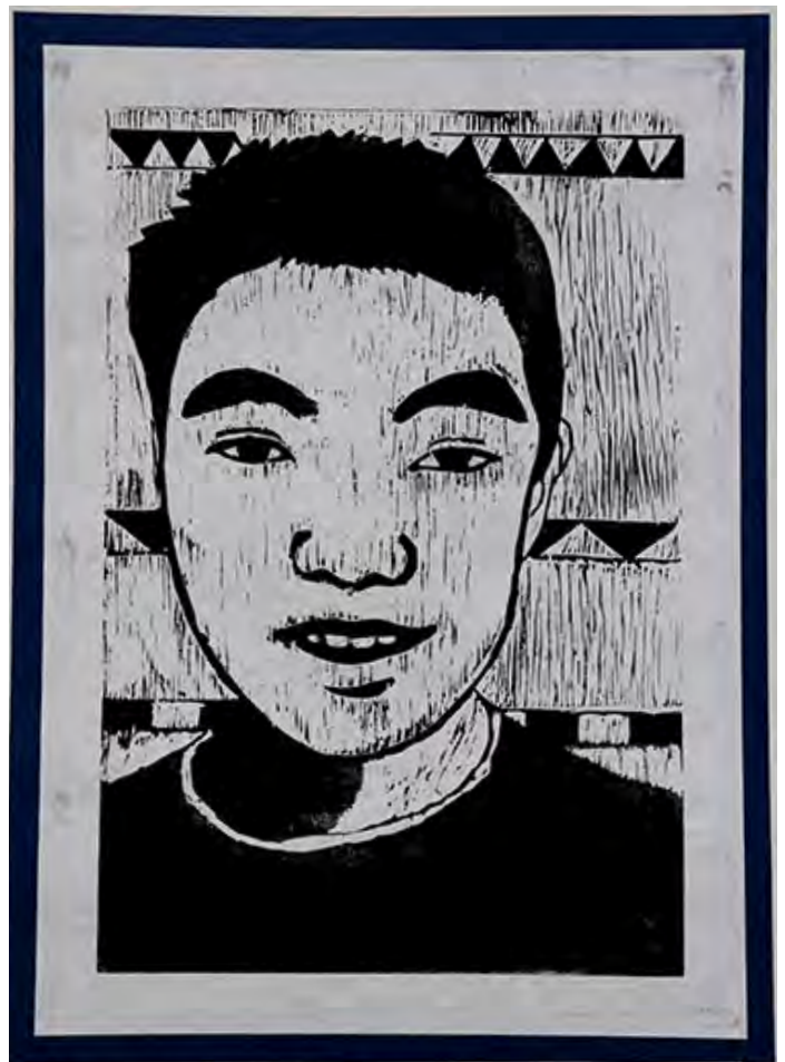
6年 いつもの自分 大変な場所もありましたが最終的に全てほれました。