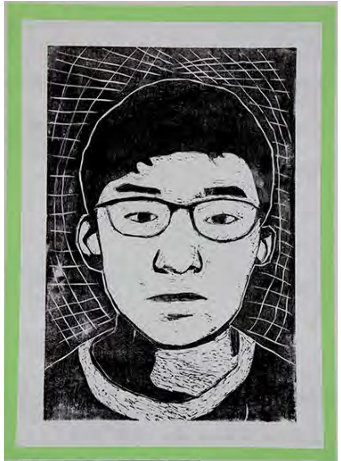
6年 今の自分 影の部分を考えながらほり進めました。