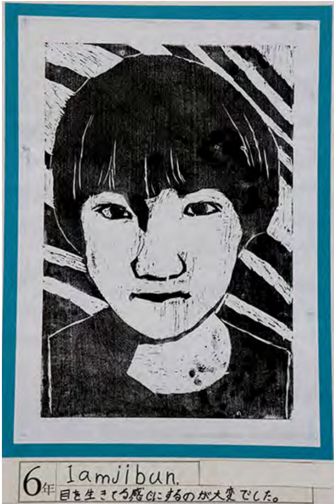
■目を生きてる感じにするのが大変でした。