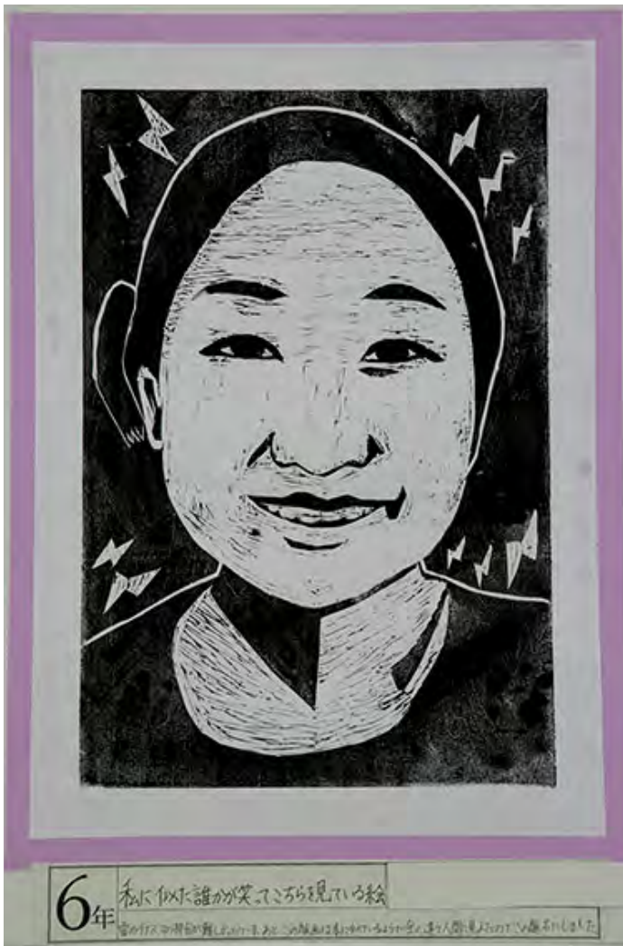
■雷のイナズマの部分に難しかったです。あと、この版画は私に似ているようで全く違う人間に見えたのでこの題名にしました。