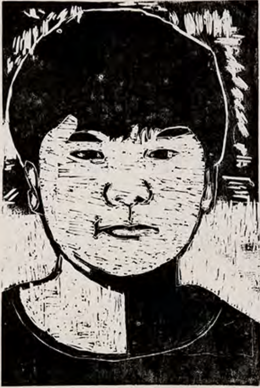
6年 自分 12才の自分であり2年後の自分がどうなっているか考えながら描きました。