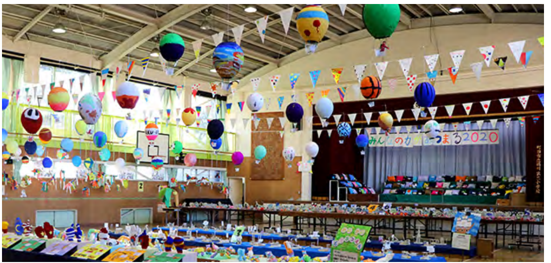
■体育館は、密にならず動線が入り乱れないような工夫が。保護者観賞がなくなったことで、展示方法の変更を余儀なくされたが、それがまたよい演出に。