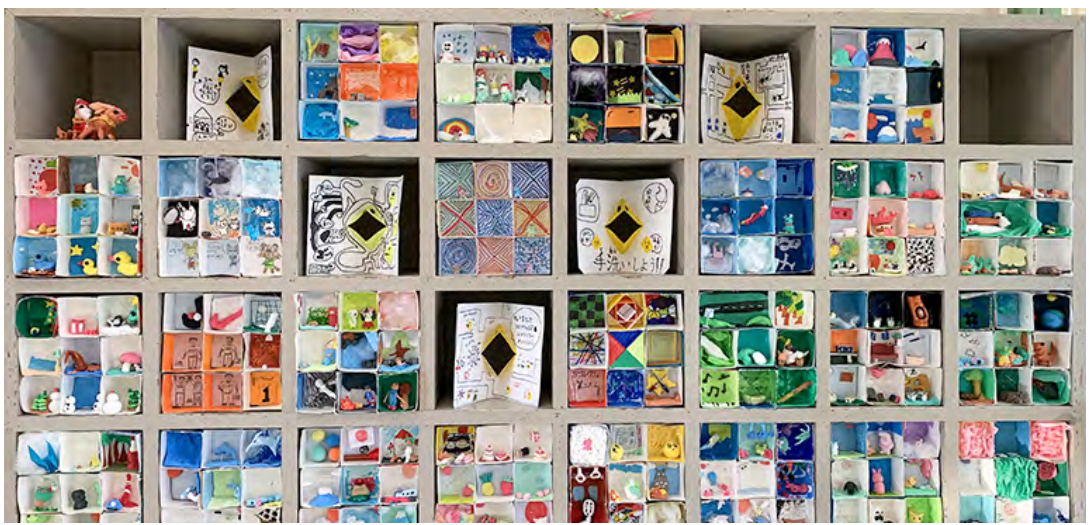
■「小さな箱の物語」牛乳パック3×3が下駄箱にまさかのシンデレラフィット！！紙粘土で作った小物が面白い世界観をかもし出す。「未来の自分」制作が終わった6年生と4年生も数名参加。