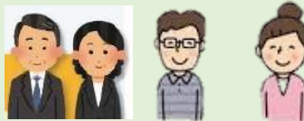
副校長 地域連携担当教員 VC