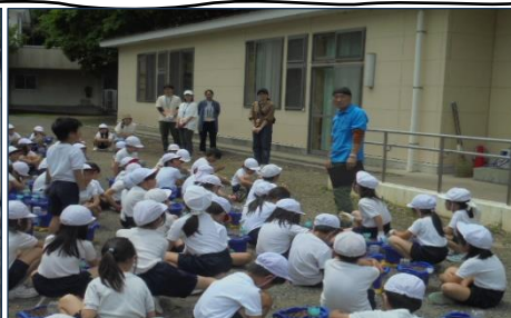
地域の方をお招きして生活科学習