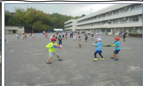
保教の会主催「ウォーターバトル」