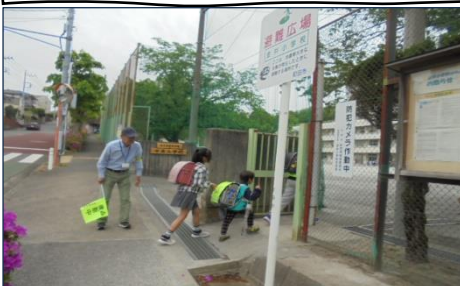
登下校の見守りボランティア活動