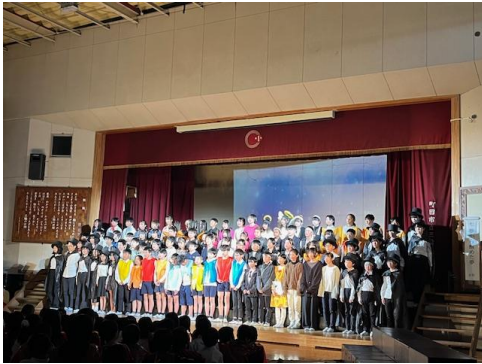
6年生 夢から醒めた夢