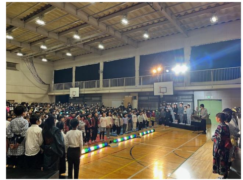
全員合唱 幕をあげよう

学芸会をはじめ、教育活動の充実は、たくさんの方々を支えられながらできていることを改めて感じています。このことに感謝の気持ちを持ちながら、今後も教職員一同力を合わせて取り組んでまいります。