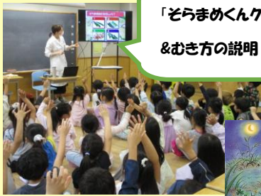
「そらまめくんクイズ」 &むき方の説明

絵本『そらまめくんのベッド』に登場する「そらまめくんの仲間クイズ」を行ったあとに、1年生が全校分の『そらまめ』(約330さや)のさやむきに挑戦しました。子供たちは、においをかいだり、さやの中の綿毛を触ったりしながら、夢中になってむいていました。「楽しかった！もっと皮むきしたい！」という子がたくさんいました。みんなで協力してむいたそらまめは、塩ゆでにしておいしく食べました。初めて食べる子もいましたが、自分たちでむいた特別な味を、しっかり味わって食べていました。