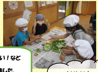
おいしい！ ちょっとにがて！