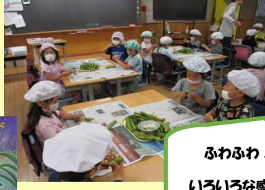
ふわふわ！変なおい！など いろいろな感想がありました。