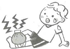
冷やして安静にする