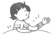
押さえて圧迫する