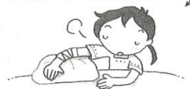
安静にして動かさない