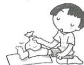
痛いところを冷やす