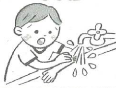
傷口の砂や泥を水で洗う