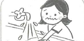
痛みがなくなるまで、流水で冷やす