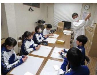
職場訪問学習の様子

本校の進路学習は、町田市の推進するキャリア教育にもとづき、職場訪問学習などの学習を通じて、一人一人の生徒の社会的・職業的自立に向けた教育を展開しています。また、「移動教室」、「修学旅行」などを通じて、自国の文化に対する理解を深め、国際社会の中でたくましく生きる資質・能力の育成を図っています。