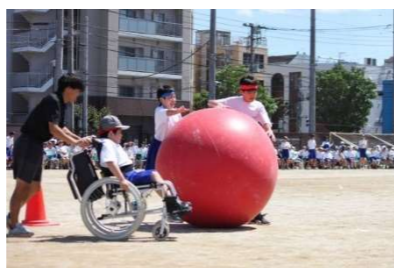
↑体育大会 わかば学級競技