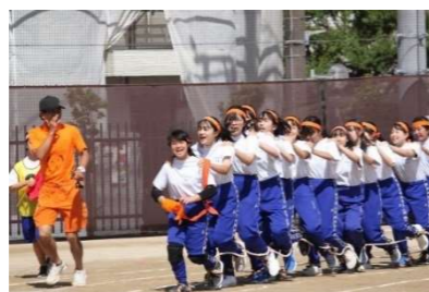
↑体育大会 3年ムカデ競技