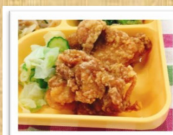
簡単給食 人気No.1★鶏の唐揚げ (3月18日実施メニュー)

町田市は、生涯にわたって間断のない食育を推進しています。この食育推進の一環として、料理レシピサイト『クックパッド』で、小学校や中学校、保育園などの給食のレシピの提供を行っています。町田市おススメのレシピを、 192レシピ (※)公開中! ぜひ、日々の食事づくりの参考にしてください!