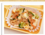
簡単給食 キムチ豆腐 (3月3日実施メニュー)