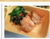
簡単給食 大分名物・とり天 (3月10日実施メニュー)