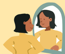
Give yourself a pep talk