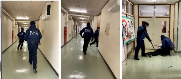
1. 現場へ急行! >>> 2. 不審者発見! >>> 3. 不審者確保!

もし不審者が校内に侵入して来た場合、どのように対応するのか? 2月4日(火)に警察と連携しての訓練を行いました。教室では不審者の教室侵入を防ぐためバリケードなどを作り、生徒たちの身の安全を確保しました。