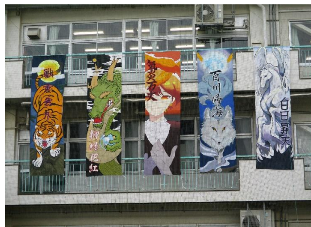
令和6年度 体育祭団旗