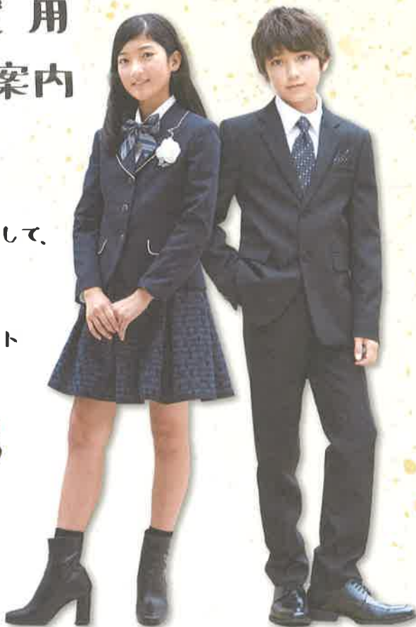
※写真はイメージとなります。