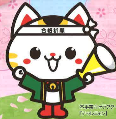
本事業キャラクター 「チャレ三ちゃん」