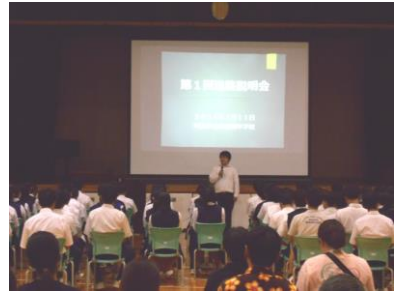
第1回進路説明会の様子

7月11日(木)、3年生と3年生保護者を対象に第1回進路説明会を実施しました。現在、中学校卒業後は様々な選択肢があります。その概要の紹介と高校入試の方法やその仕組みについて3学年教員から説明がありました。この進路説明会を通し、夏季休業中に目標へ向かってしっかり学習に取り組んでもらいたいと教員は考えていましたが、3年生の皆さんはどのように夏休みを過ごしたのでしょうか。暑い中参加してくださった保護者の皆様、ありがとうございました。第2回は10月18日(金)に実施します。