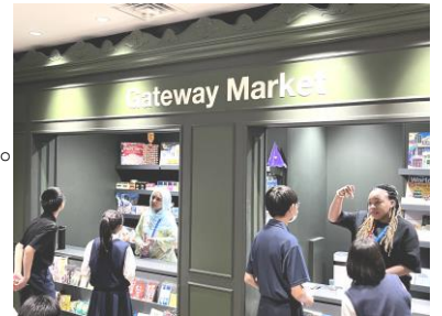
アクティビティの様子

9月5日(木)に1年生は江東区にあるTOKYO GLOBAL GATEWAY(TGG)を訪問し校外学習として英語の体験学習を行いました。すべてのアクティビティがICT機器やジェスチャーを交え、指示や説明すべてが英語で行われました。マーケット、食堂、空港、お土産屋などでの会話や、日本のおもてなし文化を英語で体験することができました。生徒は実用的な英語を使って学ぶことができ、楽しくアクティビティに参加することができました。