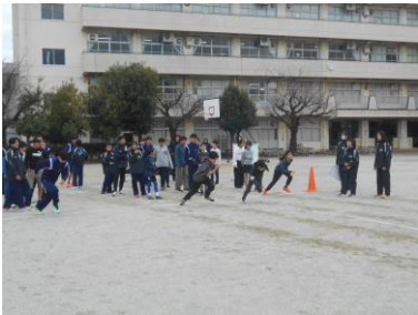
陸上競技部の体験会の様子

12月26日（金）、27日（土）にNANNARU フェスタを開催しました。この2日間で約1000名の方の参加がありました。多くの小学生が部活動体験に参加しましたが、本校の生徒たちは小学生たちに練習方法などを優しく教え、普段の学校生活では見られない姿が見られました。また、雑貨やお菓子を作るワークショップ、PTA本部による制服リサイクル販売、ゲームコーナー、キッチンカーなどもあり小さいお子さんから大人の方まで楽しめるイベントになり、南成瀬中学校のことを知っていただきました。