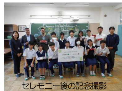
セレモニー後の記念撮影

今年度は授業時数特例校ということで、3年生の技術分野の授業時数を増やしプログラミング教育を重視しています。プログラミング学習では、NPO法人「みんなのコード」のスタッフの方にも協力いただいております。その繋がりで、3年生の教材（各種センサーが取り付けられた基盤）をサウジアラビア王国のアラムコ社様から借用させていただくことになり、それを記念して7月2日（火）にセレモニーが行われました。模擬授業、贈呈式、メディアインタビューなどが行われました。