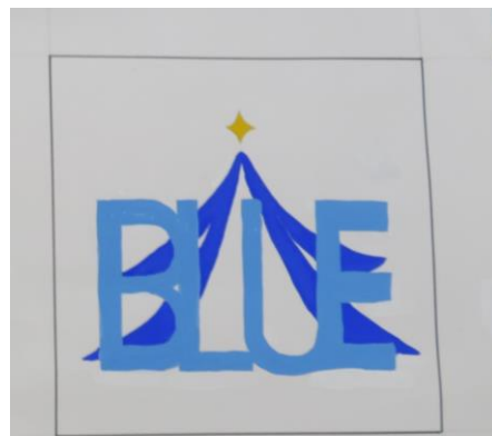
右：3 学年 ロゴマーク