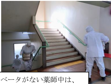
エレベータがない薬師中は、 4 階までも階段で運びます

そして、忘れてならない「いただきます」「ごちそうさまでした」は、これからも必ずクラス全員でしましょう。生き物の肉を食する、つまり、命をいただくことへの感謝だけでなく、私は、すべての食材の生産者、流通業者、調理人、配送者、クラスの給食当番、保健給食委員、学校の先生方の指導、色々な人が関わり、皆さんの元に提供されていることへの感謝の気持ちを忘れずに「いただきます」を、そして残さずに美味しく食べました、という気持ちを込めて「ごちそうさまでした」と言ってほしいと思っています。