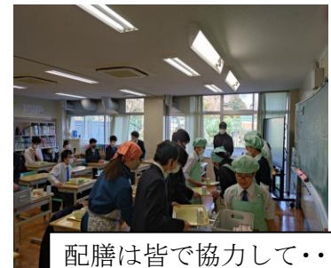
配膳は皆で協力して・・・