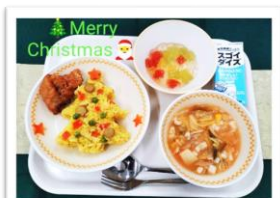
アレルギー専用食