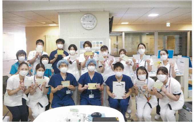
★医療従事者の皆さんから、児童・生徒の皆さんにお写真が届いています。

謹啓 厳寒の候、平素は格別のご厚誼にあずかり、厚く御礼申し上げます。 この度は、35校たくさんの生徒の皆さんの気持ちのこもった、とても素晴らしい応援メッセージをいただき、感謝いたします。 皆様からのメッセージにより、当院を応援してくださる皆様方がいることが職員の何よりの励みとなります。これからも、この状況を乗り越えるべく、職員が一丸となり医療活動へ努めてまいります。 未筆ながら、今しばらく厳しい状況が続くかと存じますが、皆様のご健康と一日も早く平穏な日々が戻りますよう祈念申し上げます。 略儀ながら書面にて御礼申し上げます。