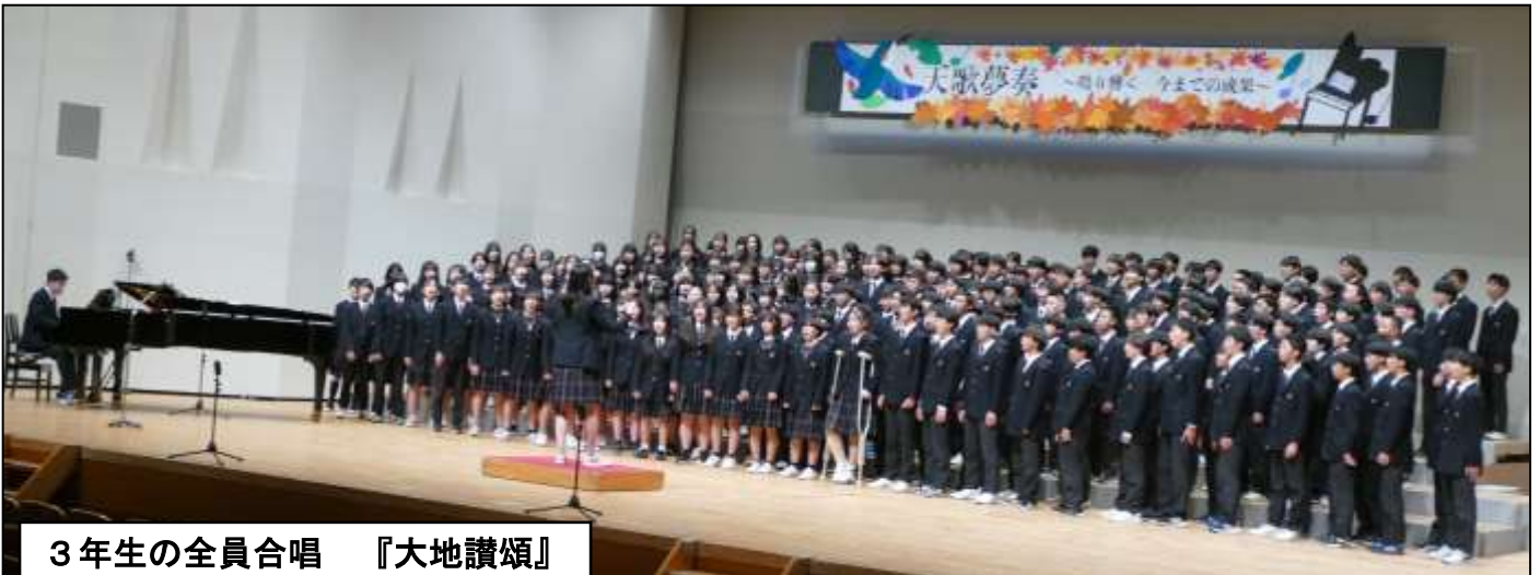
3年生の全員合唱 『大地讃頌』

3年生の「大地讃頌」は本当に最高の歌声でした。まさに3年間の集大成と呼ぶにふさわしい合唱でした。「この学級、この学年で頑張ってきた合唱のことを思えば、忠生中学校で過ごす残りの5ヶ月の間に、どんな困難が待ち受けているとしても乗り越えることができる。」と、そんな風に思わせてくれる合唱でした。3年生の取組は、確実に1年生・2年生の心にも残りました。