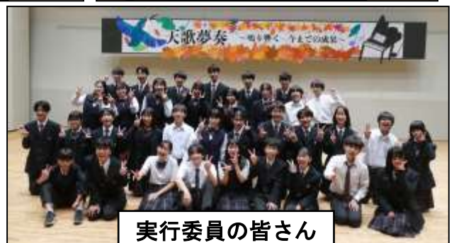
実行委員の皆さん

この大成功の裏では、陰ひなたなくクラスのため、学校全体のために努力してくれた実行委員の生徒の皆さんや、実行委員を支えた担当の先生方のおかげです。本当に、ありがとうございました。