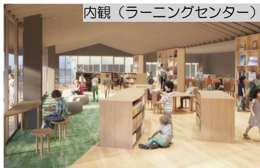
内観（ラーニングセンター）