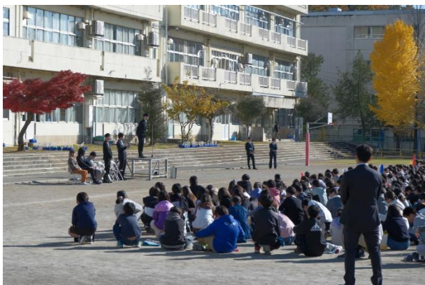
制作者が校歌・校章に込めた想いを語る

報告会には校歌・校章の制作者も出席し、制作過程を振り返るとともに、新しい校歌・校章に込めた想いが述べられました。また、この日のために練習した校歌を全員で歌いました。