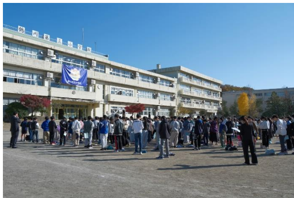
練習した新しい校歌をみんなで歌唱