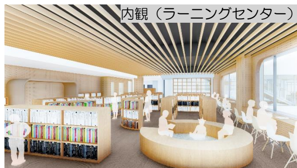
内観（ラーニングセンター）