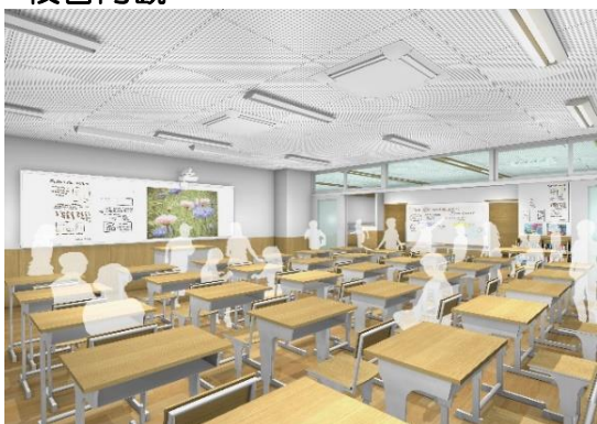
普通教室・オープンスペース