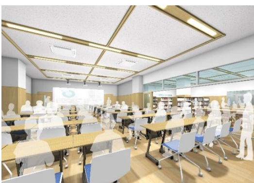
ラーニングセンター

普通教室には、多様な学習活動に対応するほか、児童にゆとりのある生活環境を提供するために、オープンスペースが併設されています。